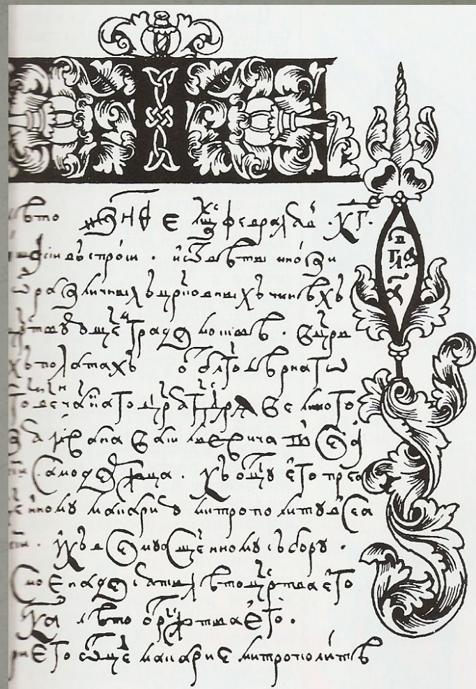
Стоглав . Титульный лист. 1600 г.

Первый русский царь окружил себя новыми советниками, мнением которых он весьма дорожил. В 1551 году по инициативе Ивана IV состоялся Стоглавый собор, который принял важнейшие решения по устройению церковной жизни.