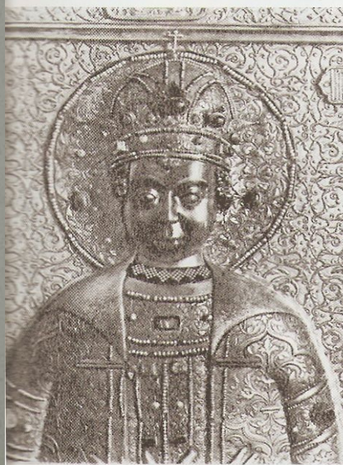
Царевич Дмитрий. Деталь раки из Архангельского собора Московского Кремля. Мастер Гаврила Овдокимов «с товарищи». 1630 г.