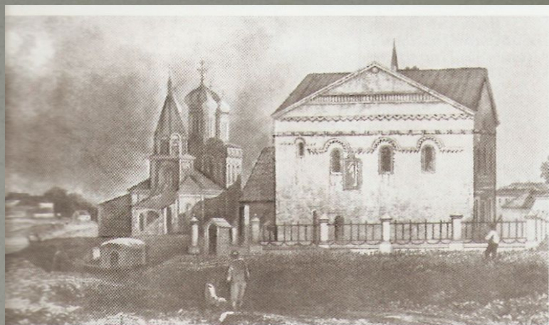
Терем царевича Дмитрия в Угличе. Рисунок 19 в.

В марте 1553 года Иван Грозный тяжело заболел и был близок к смерти. Бояре и князья должны были присягнуть на верность царевичу, младенцу Дмитрию. В боярской среде возникли распри, в которых принял участие князь Владимир Андреевич Старицкий, двоюродный брат царя. Но в конце концов, присяга была принесена. Позднее выздоровевший Иван IV рассматривал эти споры как измену.