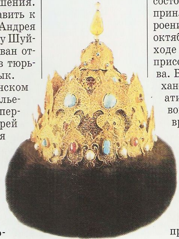
«Шапка Казанская». Сер. 16 в.

царя, п лить Ро ширить В 155 состоял принял роению октябре ходе на присоед ва. В 16 ханско ативе война враг бал э Г Д во при