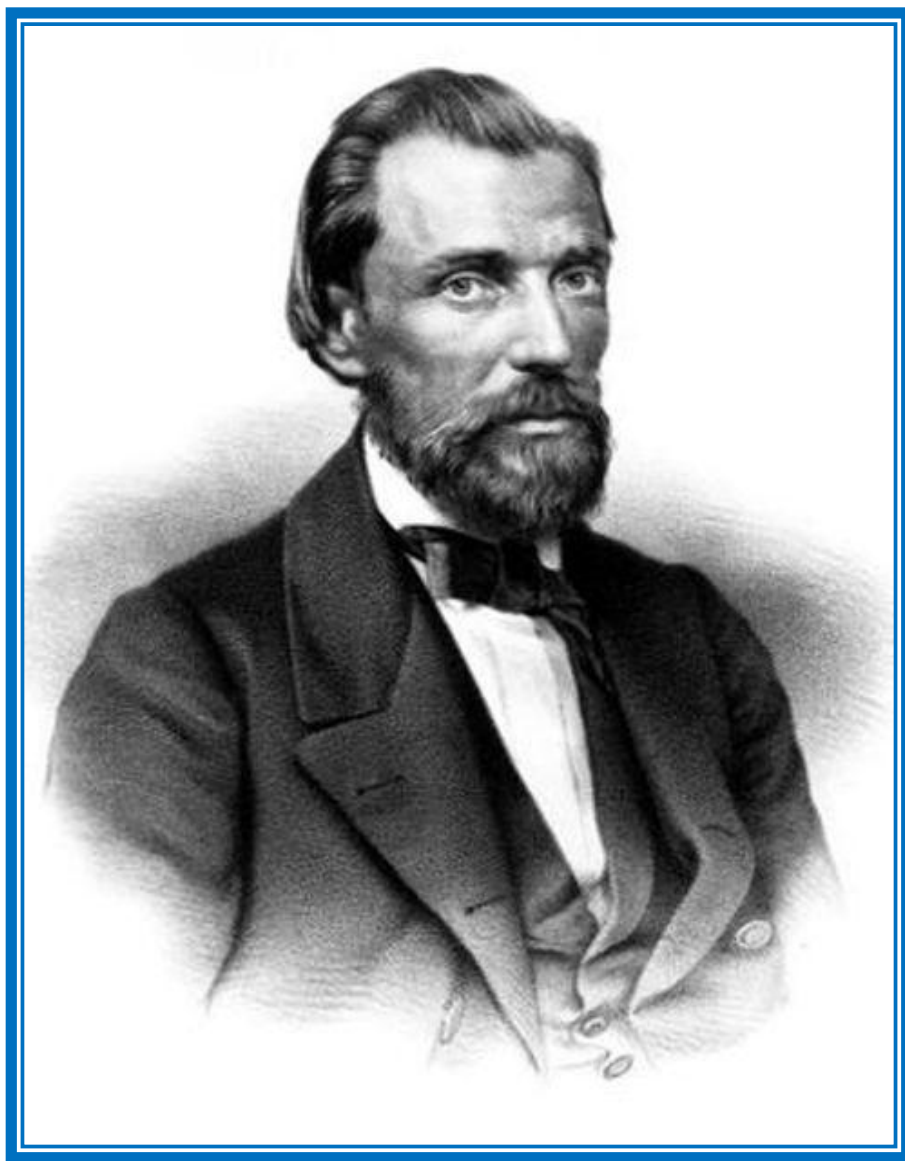
Иван Саввич Никитин 1824-1861