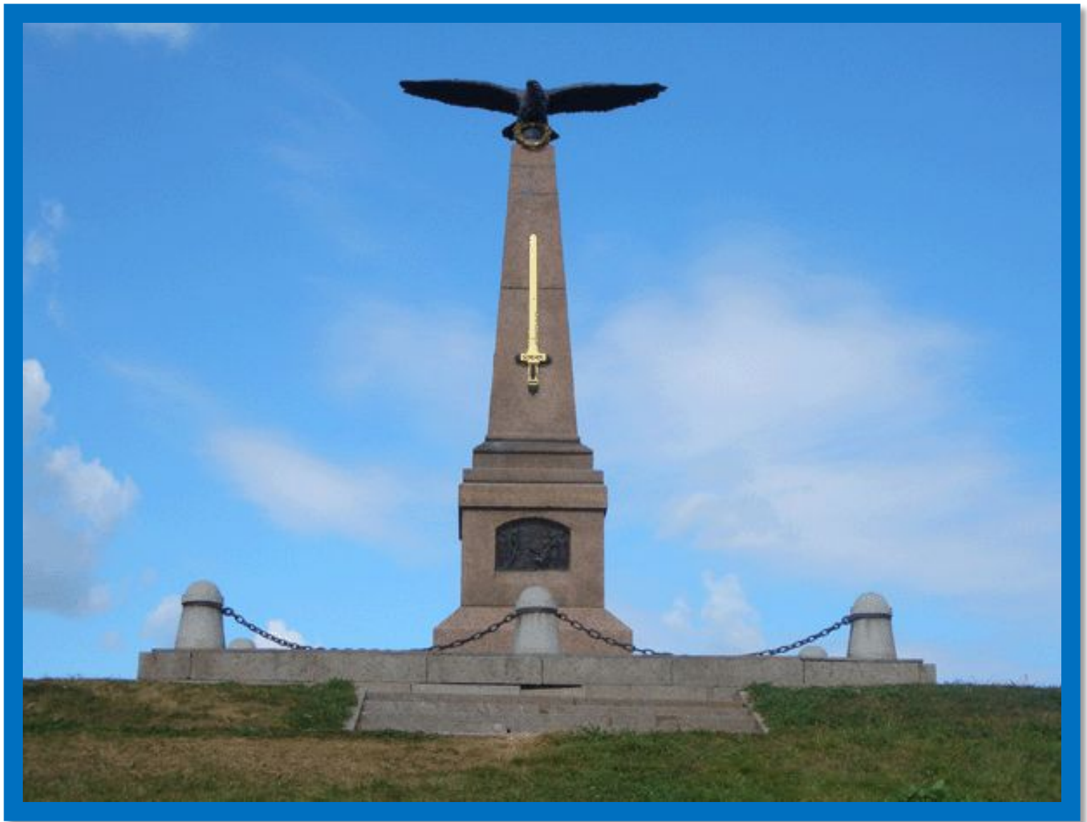
Памятник русским воинам на Бородинском поле.