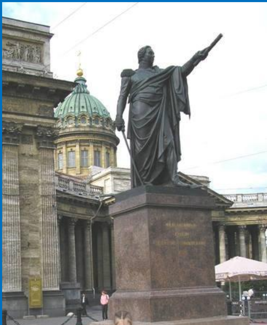
Памятник Кутузову около Казанского собора.