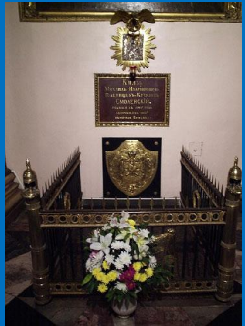
Гробница М. И. Кутузова в Казанском соборе.