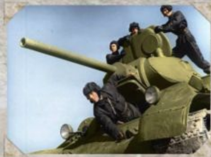
Монголия. лето 1944г