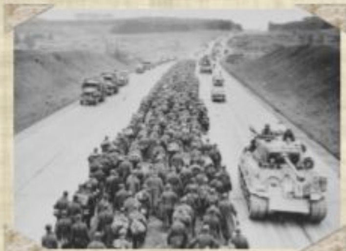
На фронт. 1944 г

Японцы разбиты и отброшены назад. Подписана конвенция о капитуляции врага, о ненападении на Советский Союз.