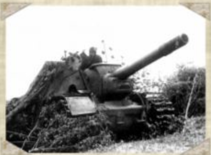
Американские танки для русских.