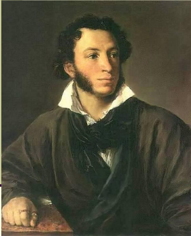
А. С. Пушкин