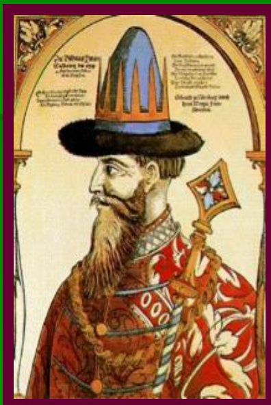
Иван Висковатый , дьяк Посольског о приказа