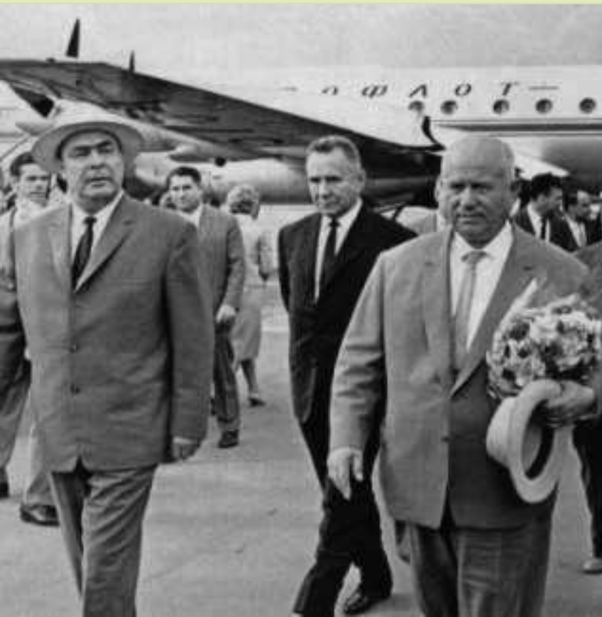
Л.И. Брежнев и Н.С. Хрущёв

В октябре 1964 года Хрущёв был обвинён в «волюнтаризме и субъективизме», отстранён от руководства партией и страной и отправлен на пенсию. Первым секретарём ЦК КПСС был избран Л.И. Брежнев, председателем Совмина стал Косыгин А.Н.