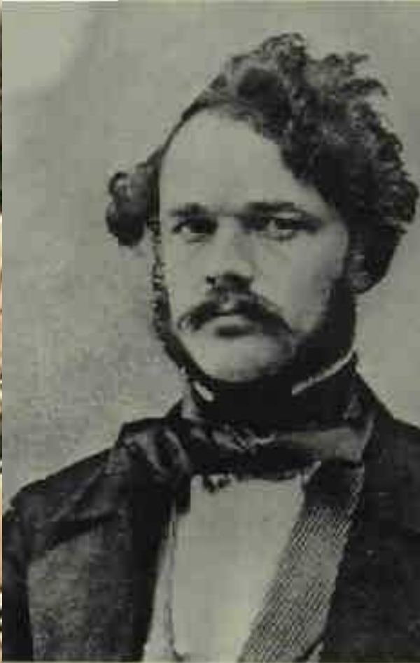
Werner von Siemens, 1845

Э. фон Сименс с семьей. Сименс – предприниматель, получивший дворянство