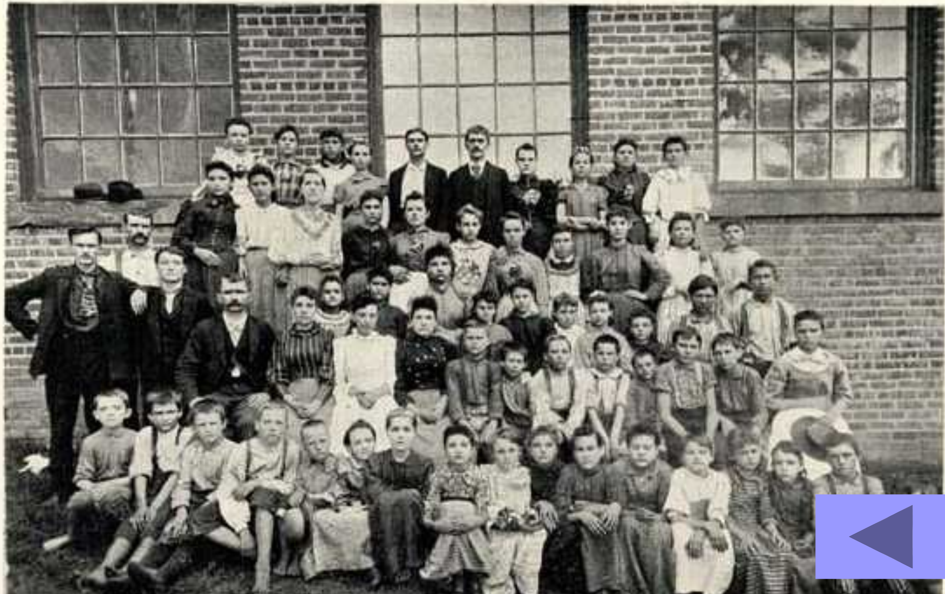
Работники хлопковой фабрики (США, кон. 19 в.)