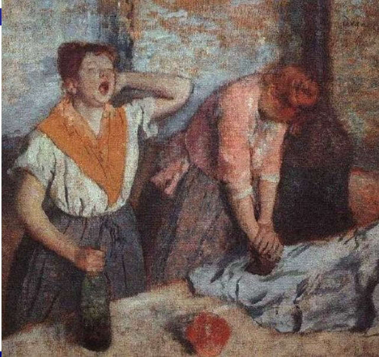
Гладильщицы. Эдгар Дега (1884)