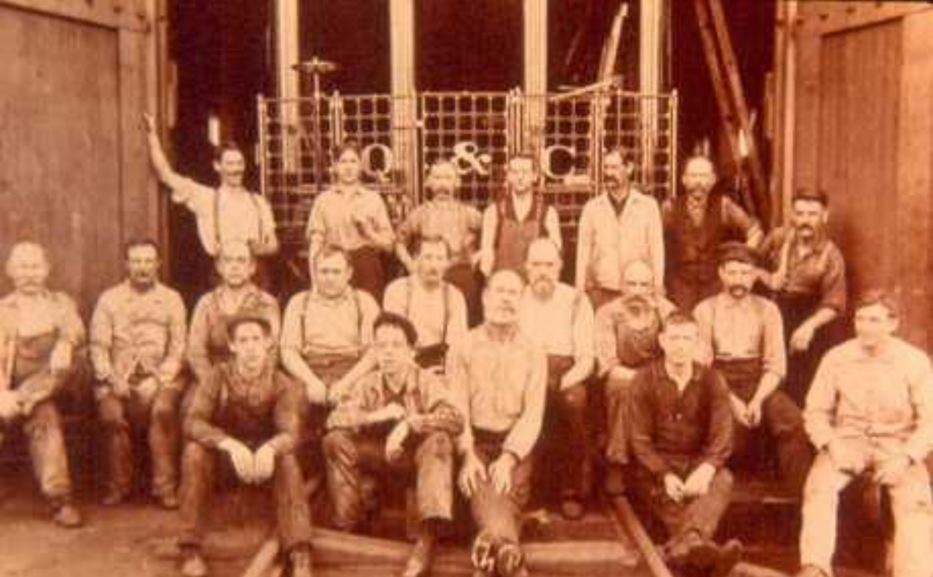
Американские железнодорожные рабочие (1910 г)