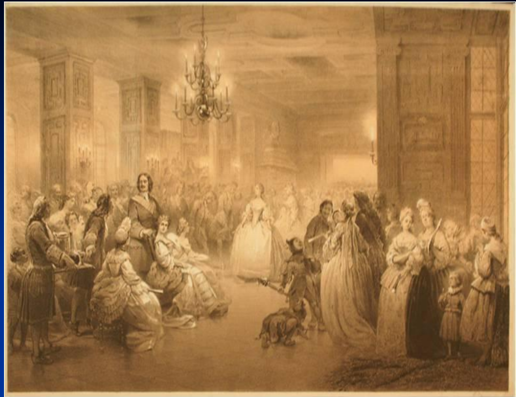
Ассамблея при Петре I

Въ первыхъ наипаче всего должны дѣти отца и ма- терь въ великой чести содержать. И когда отъ родителей что имъ прѣказано бы- ваетъ, всегда шляпу въ рукахъ держатъ, а предъ ними не вѣдвоятъ, и возлѣ ихъ не садятся; и прежде оныхъ не засѣдаютъ, при нихъ во окно всѣмъ тѣломъ не выглядывать, но все попеннымъ образомъ А съ великимъ