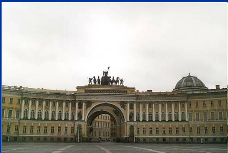
Здание Двенадцати коллегий