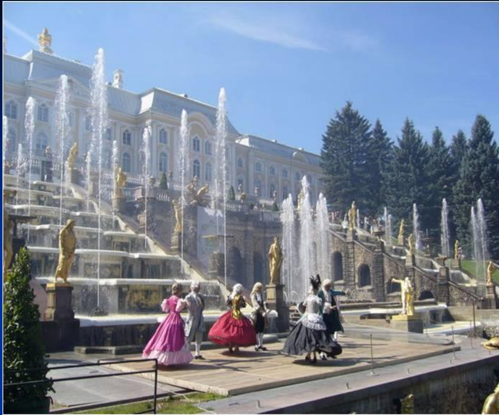
Сооружение императорского дворцового ансамбля в Петегорфе