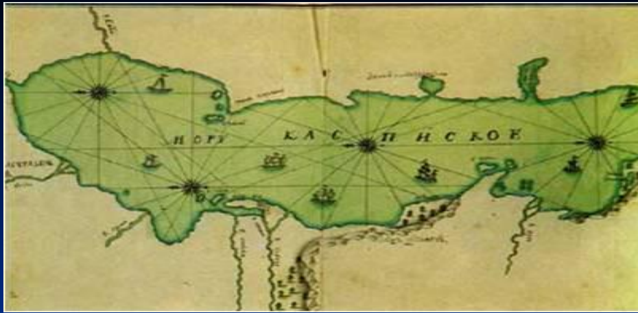
I карта Каспийского моря в России