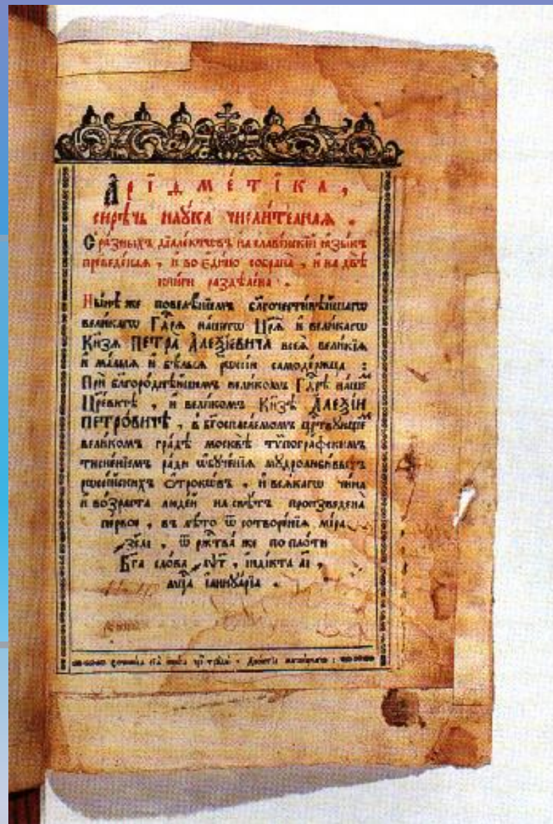
«Арифметика» Магницкого. 1703г.