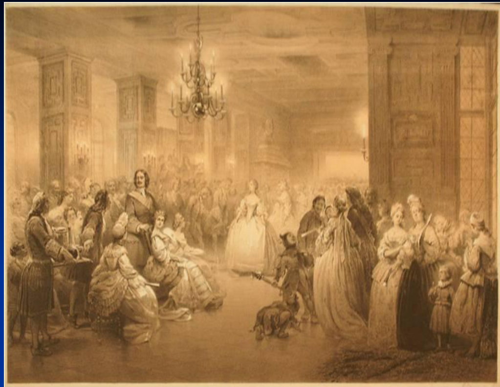
Ассамблея при Петре I

Въ первыхъ наипаче всего должны дѣти отца и ма- терь въ великой чести содержать. И когда отъ родителей что имъ приказано бы- ваетъ, всегда шляпу въ рукахъ держатъ, а предъ ними не вѣдвоятъ, и возлѣ ихъ не садятся; и прежде оныхъ не засѣдаютъ, при нихъ во окно всѣмъ тѣломъ не выглядывать, но все попеннымъ образомъ А съ великимъ