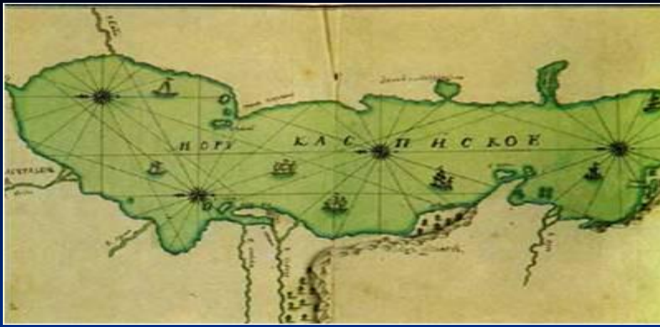
I карта Каспийского моря в России