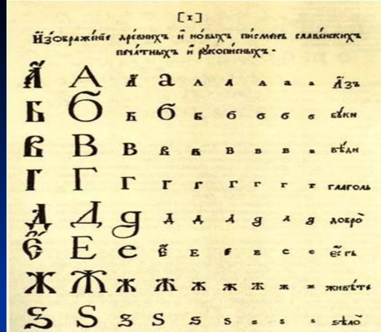
Гражданская азбука при Петре I