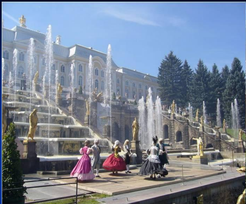
Сооружение императорского дворцового ансамбля в Петегорфе