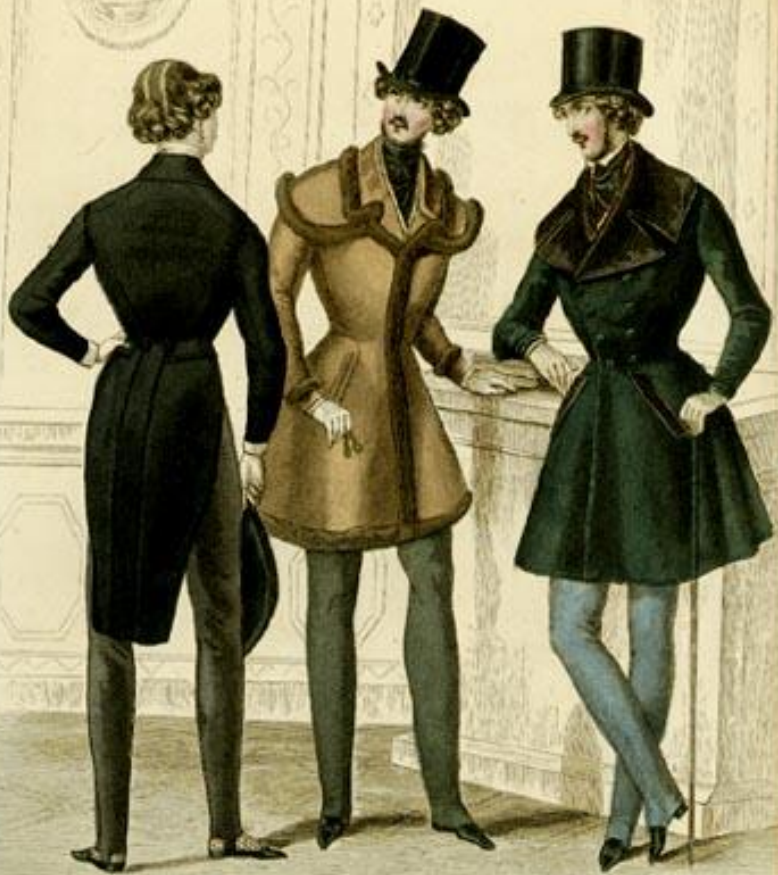
Costumes Parisiens Gazette des Salons, Journal des Dames & des Modes Costumes & tenues des Salons de M. de la Roche, R. d'Orléans, N. Chapuis de M. Propriété de M. de la Roche, Comte de la Roche. Tout le monde en parlera. Paris, chez M. de la Roche, Grand Palais.