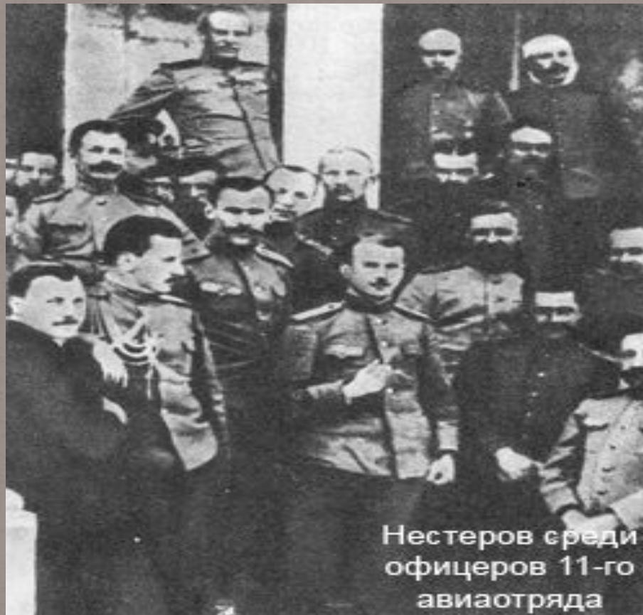
Нестеров среди офицеров 11-го авиаотряда

В июне 1913 года переведен в 11 корпусный отряд 3-ей авиационной роты