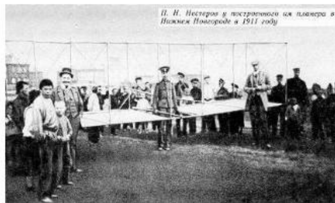
П.Н.Нестеров у построенного им планера в Нижнем Новгороде в 1911 году