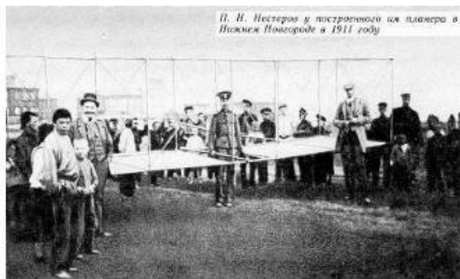
П.Н.Нестеров у построенного им планера в Нижнем Новгороде в 1911 году