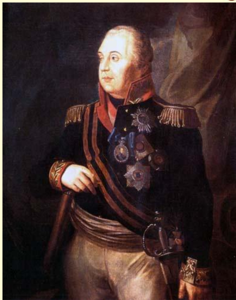
Михаил Илларионович Голенищев-Кутузов

Кутузов был участником многих войн, в которых проявил себя не только выдающимся военачальником, но и исключительным храбрецом.