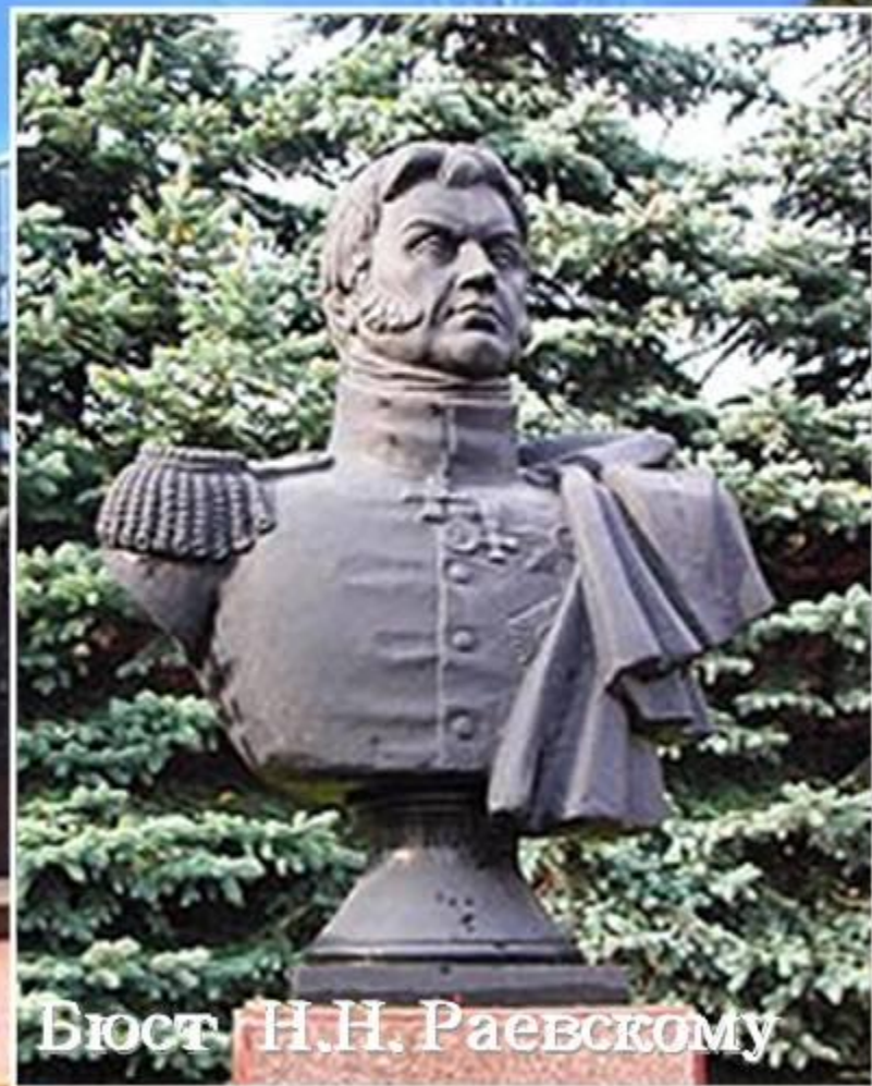
Бюст Н.Н. Раевскому