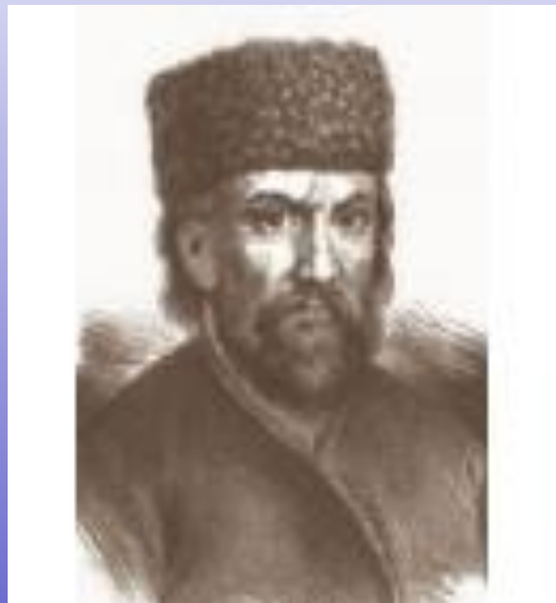
Портреты Емельяна Пугачёва