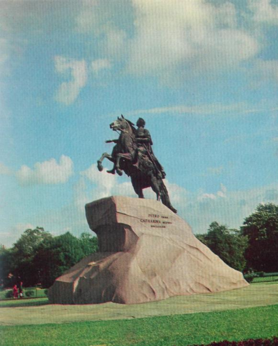
Памятник Петру I («Медный всадник»)