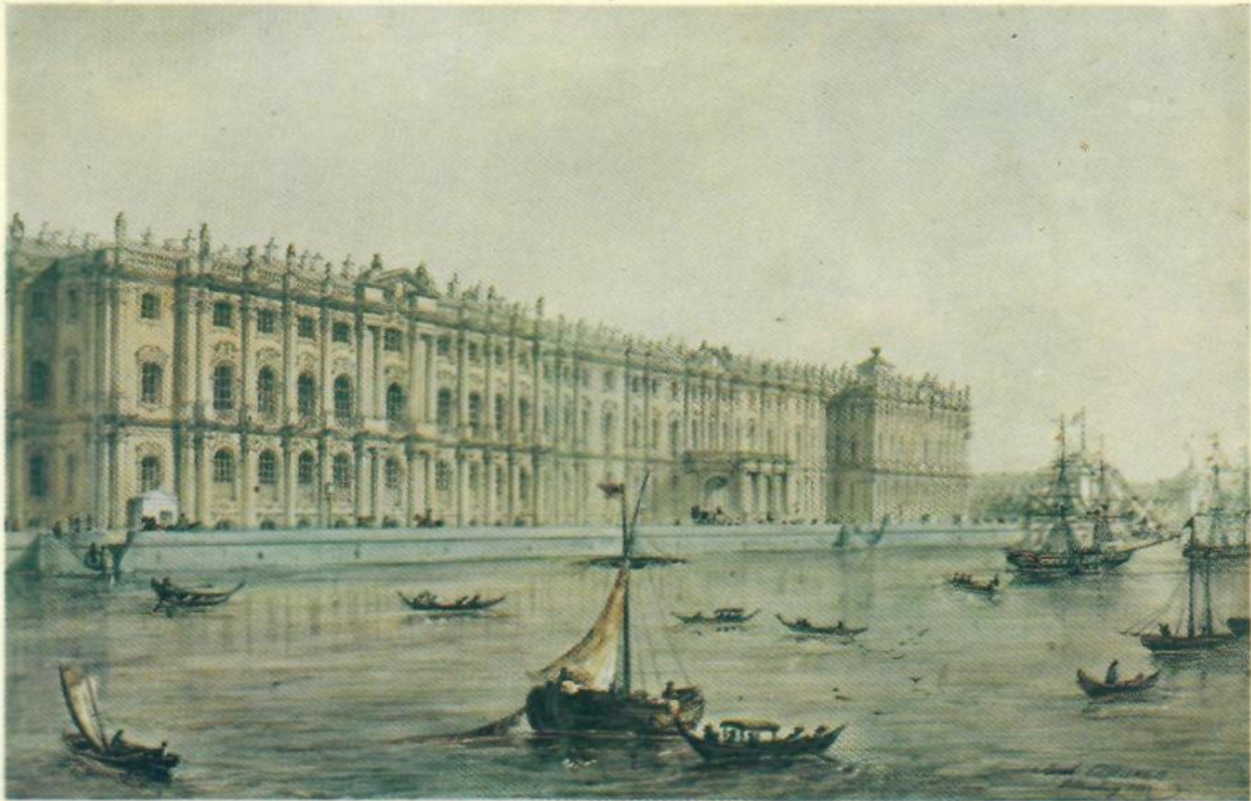
Вид Зимнего Дворца с Невы