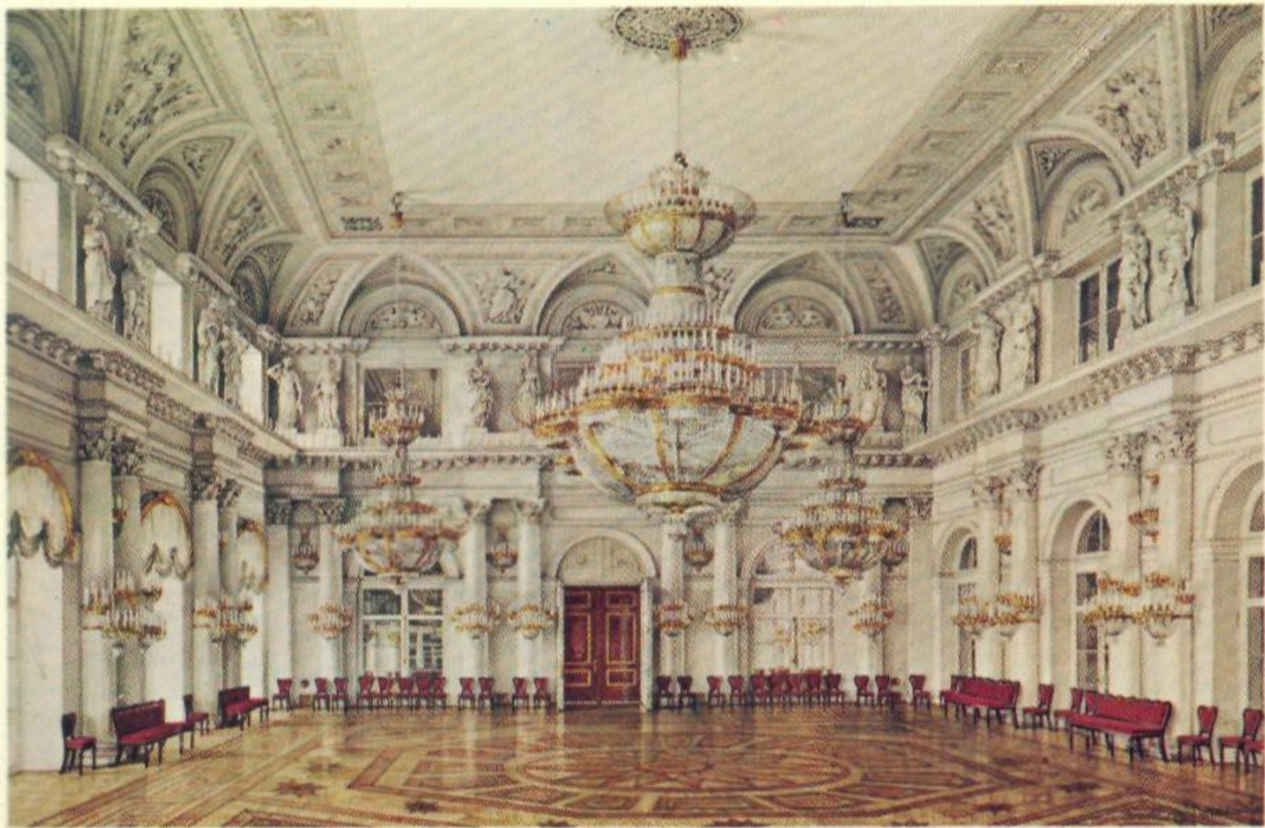
Зимний Дворец. Концертный зал.