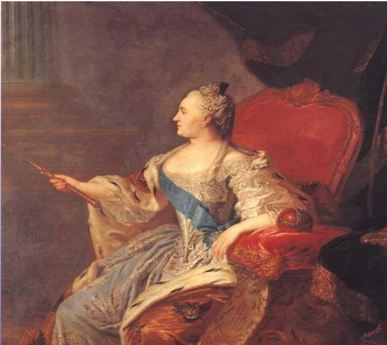
Портрет Екатерины II.