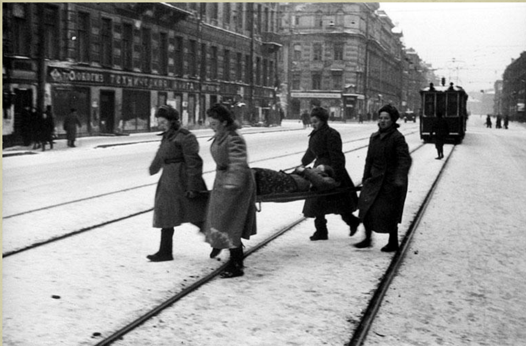
Декабрь 1943 г. Место съемки: г. Ленинград