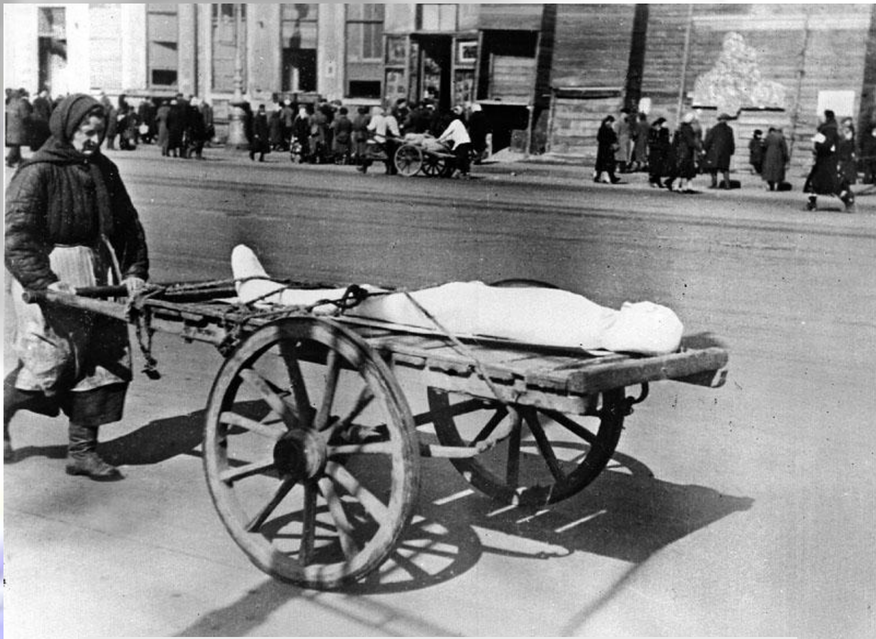
Женщина везет умершего в дни блокады Ленинграда