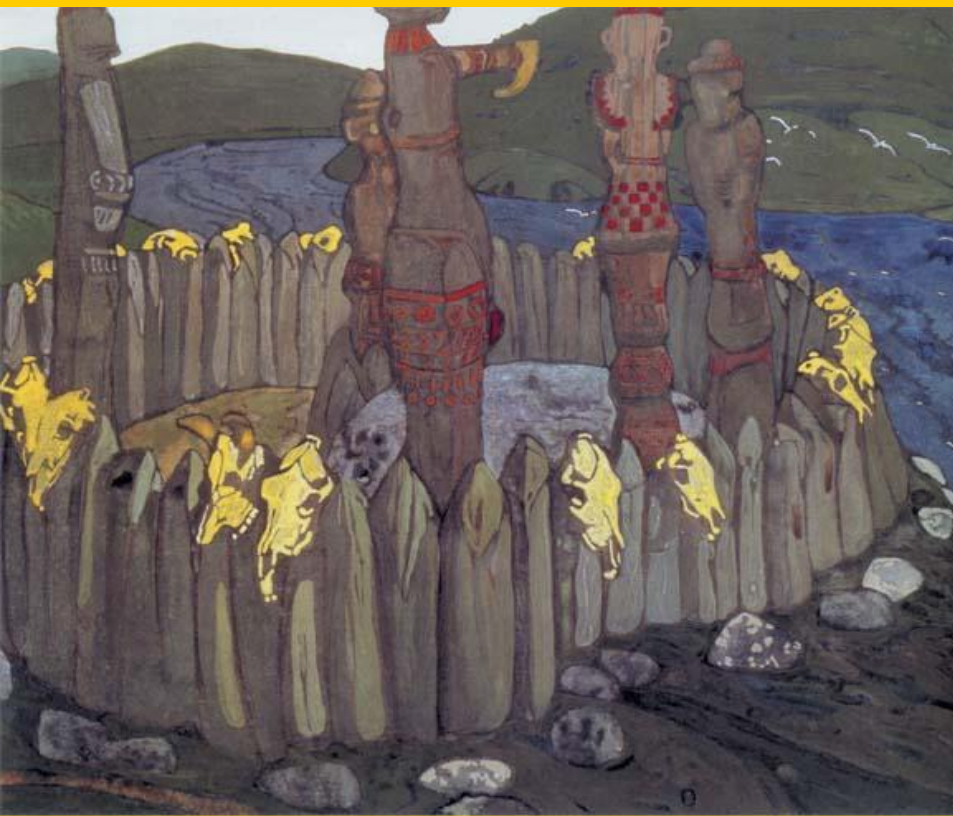
Н.Перих. Языческое капище.

Вначале Владимир решил провести языческую реформу и провозгласил верховным богом Перуна. Остальные боги были сохранены, но «подчинялись» Перуну.