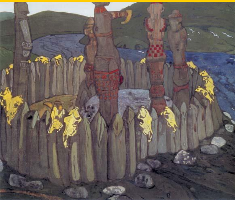
Н.Перих. Языческое капище.

Вначале Владимир решил провести языческую реформу и провозгласил верховным богом Перуна. Остальные боги были сохранены, но «подчинялись» Перуну.