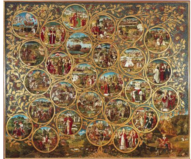
Генеалогическое древо Бабенбергов в аббатстве Клостернойбург Бабенберги (нем. Babenberger) — первая княжеская династия в Австрии (976—1246)