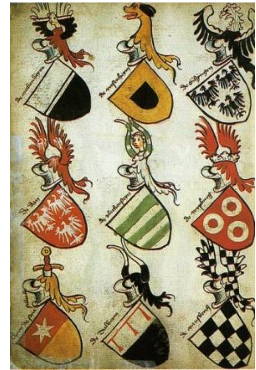
Фрагмент немецкого Хигхальменского гербовника, около 1485