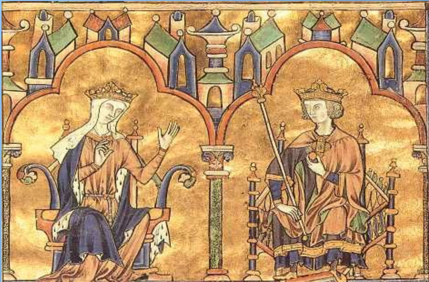
Людовик Святой с матерью Бланкой Кастильской.