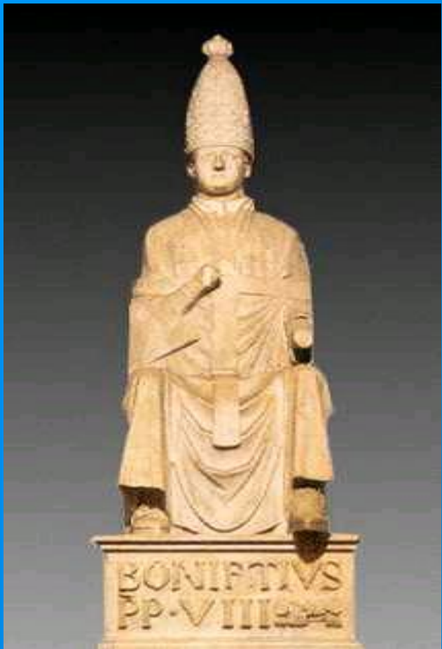
Бонифаций VIII Булла Бонифация VIII