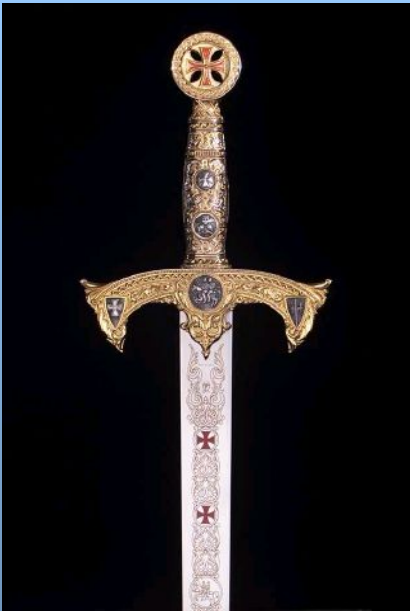
Меч тамплиеров. XIV в.