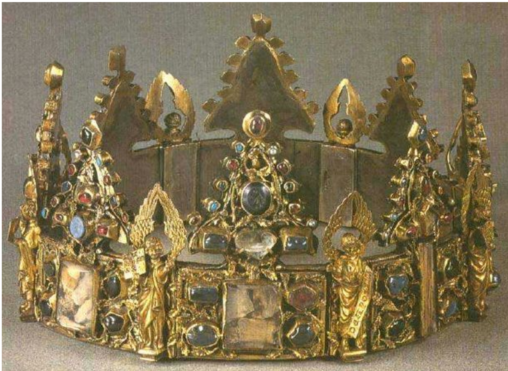
Корона Людовика Святого.