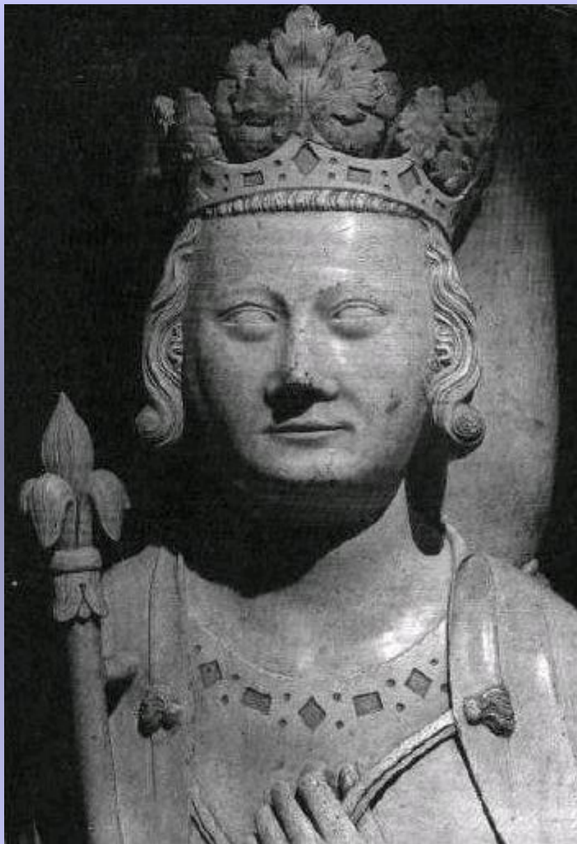
Филипп IV Красивый