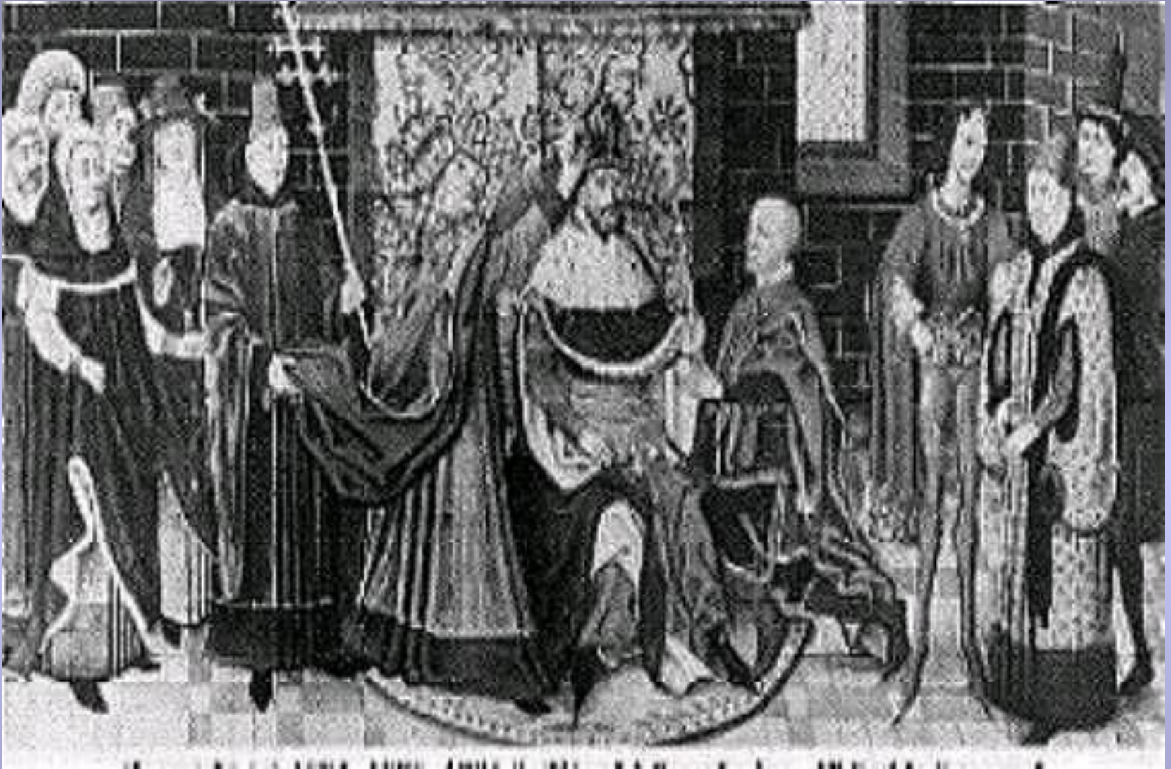
Коронация французского короля