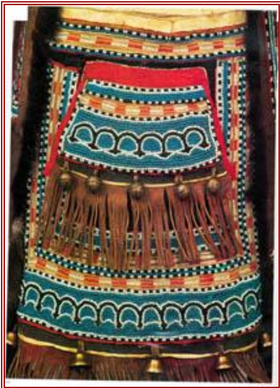
Фрагмент нагрудника мужского костюма якут.