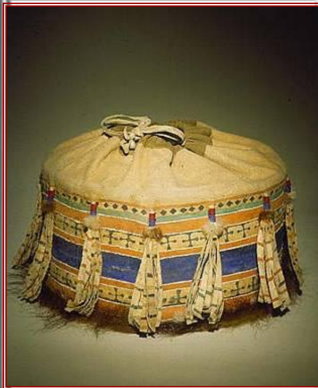
Короб для домашней утвари.