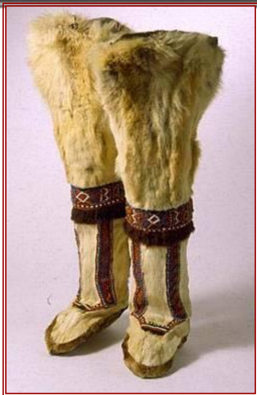
Мужская меховая обувь долган