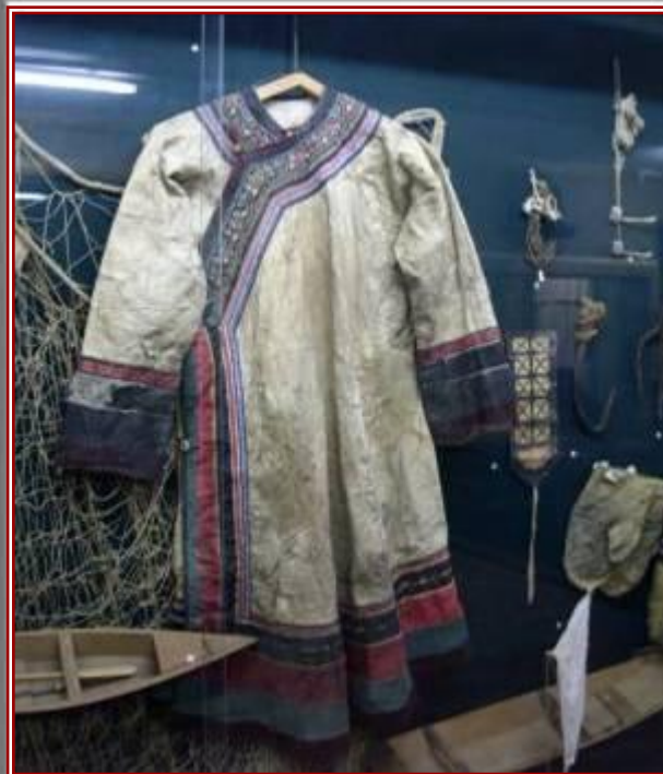
Одежда нанайцев из рыбьей шкуры