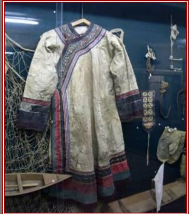
Одежда нанайцев из рыбьей шкуры