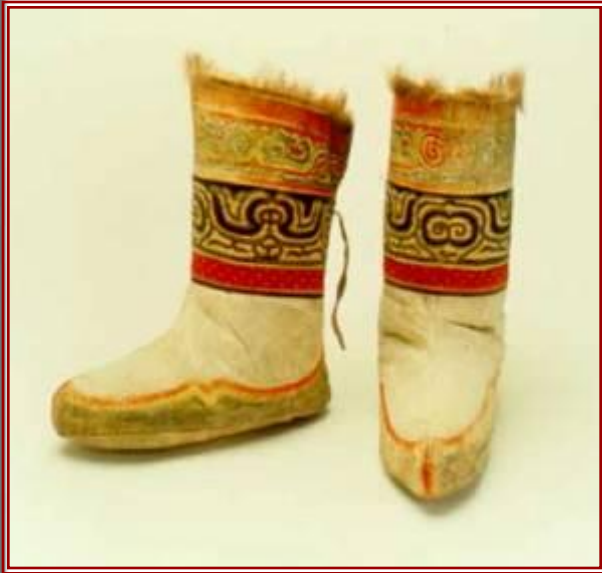
Обувь из рыбьей кожи