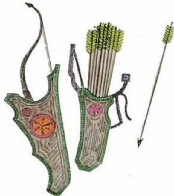
Лук и стрелы

Как шли люди в тёплую страну? Из-за чего поругались люди? Как решил наказать обиженный человек другого?