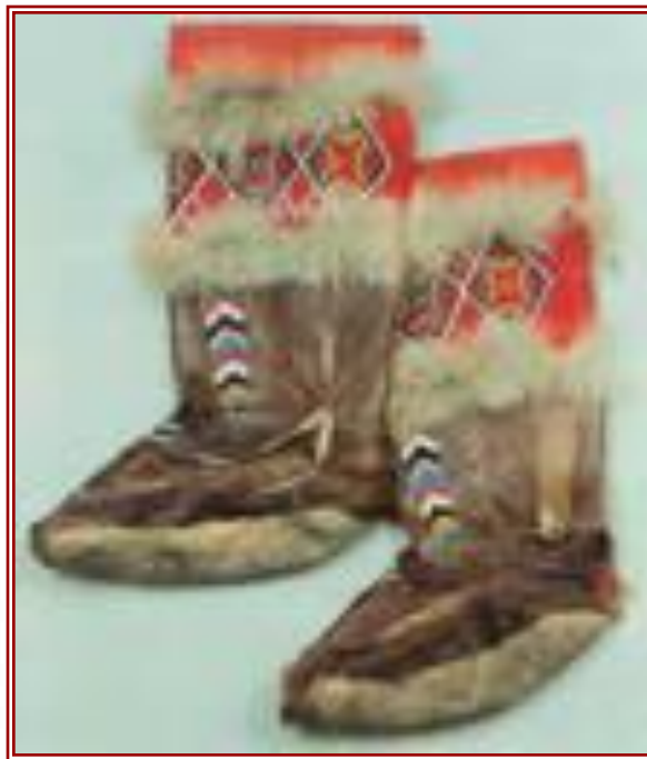
Унты - обувь