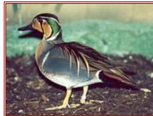
Уточка - чирок

Как отнеслись люди и птицы к словам смелого человека?