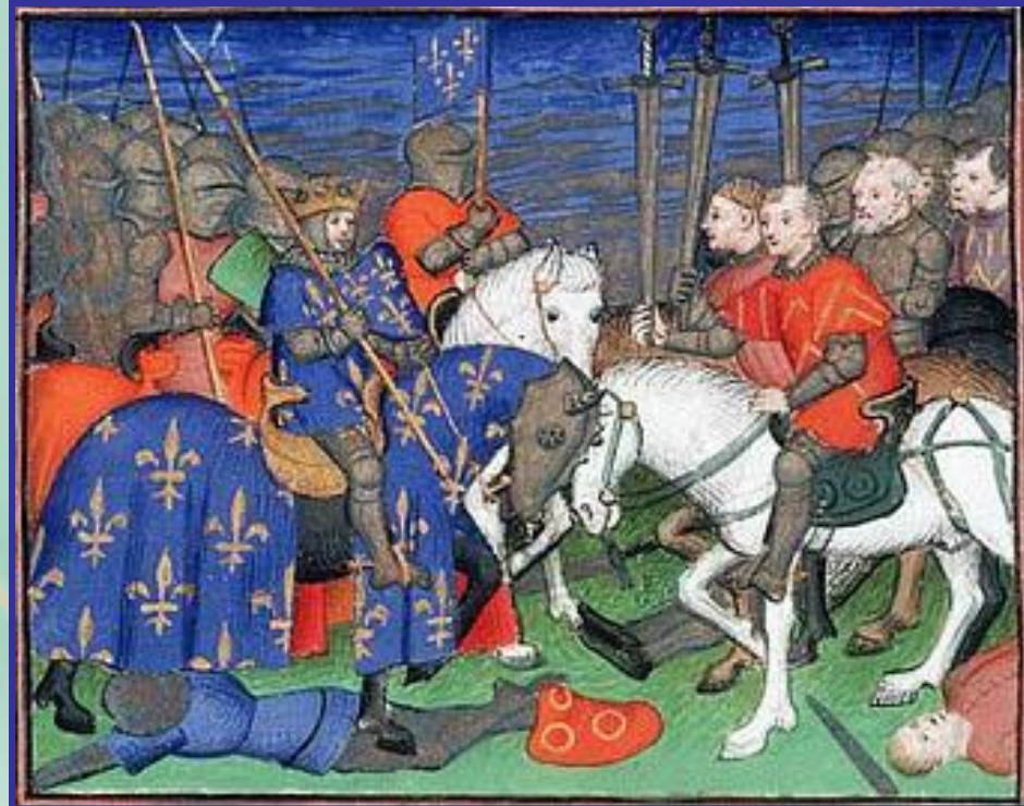
Битва при Бувине

В 1214 году Филипп II в ожесточённой битве при Бувине наголо разгромил своих противников и захватил богатые трофеи. У англичан осталась лишь часть Аквитании.