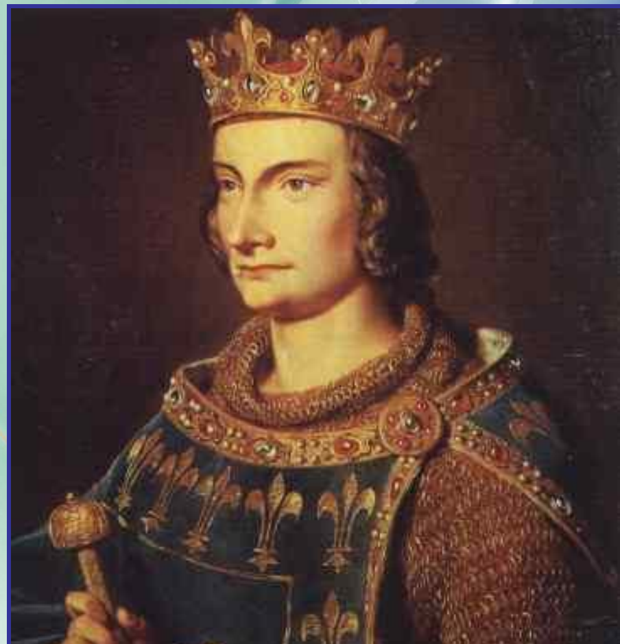
Филипп IV Красивый

При Филиппе IV Красивом было присоединено богатое графство Шампань и лежащая в Пиренейских горах на юге страна Наварра.