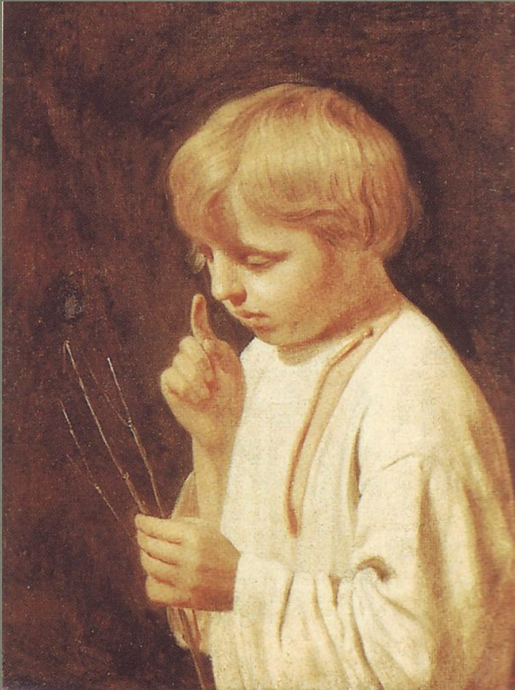
А.Венецианов «Мальчик с розгой»