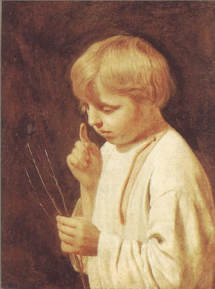
А. Венецианов «Мальчик с розгой»