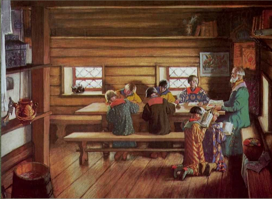
Б.М.Кустодиев «Школа в Московской Руси»