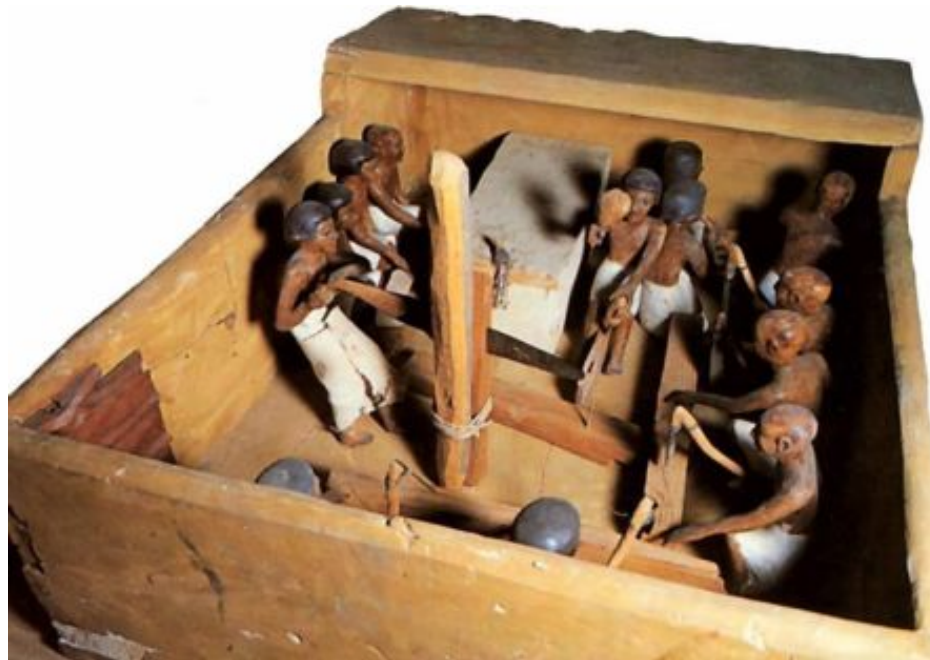
Модель древнеегипетской мастерской

? вспомните, кого называют ремесленником?