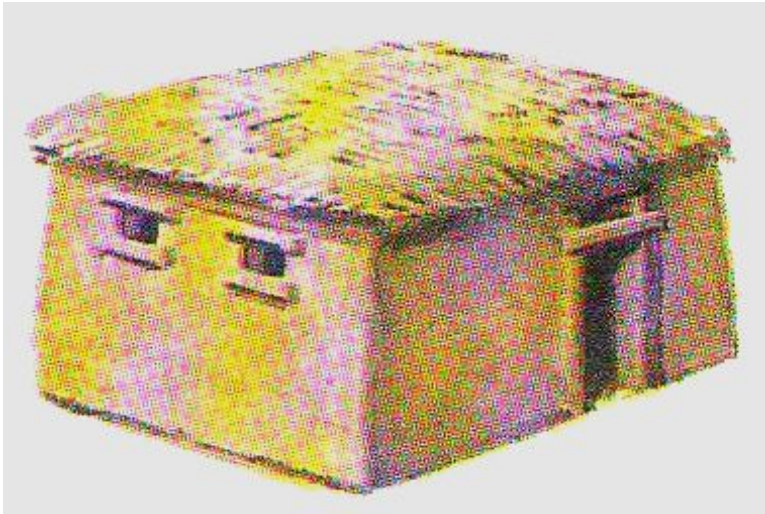
Хижина земледельца (рисунок нашего времени)