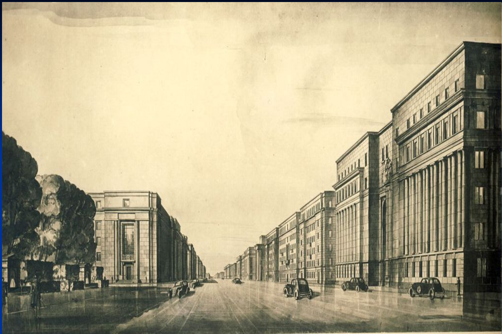
Илл.12 Перспектива Международного пр. (ныне Московского пр.) в Ленинграде (сер. 1930-х гг) .