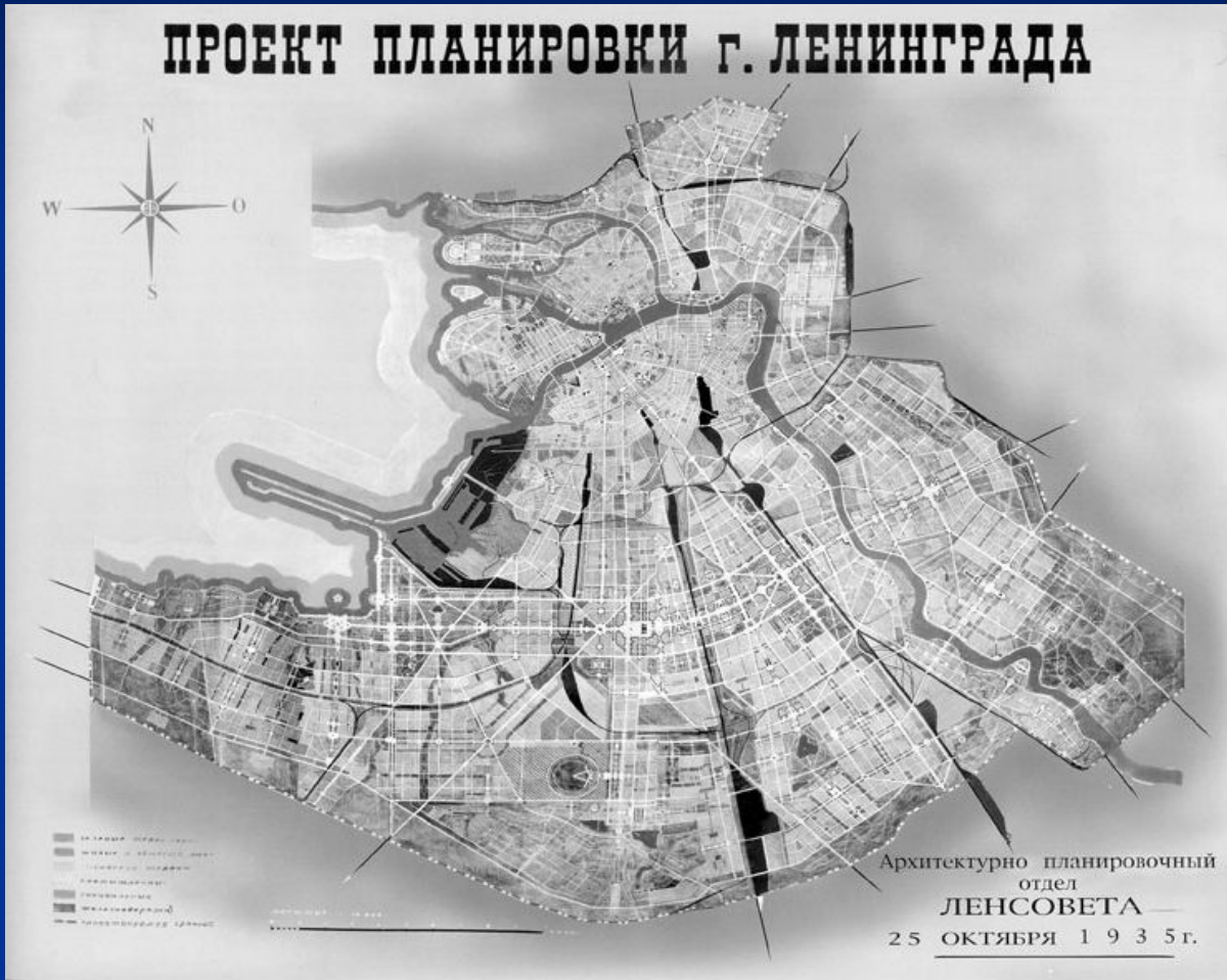
Илл. 11 Проект планировки Ленинграда (1935 г.) Утвержденный вариант

Л.А.Ильин – главный архитектор послереволюционного Петрограда – Ленинграда (1924-1938 гг)»