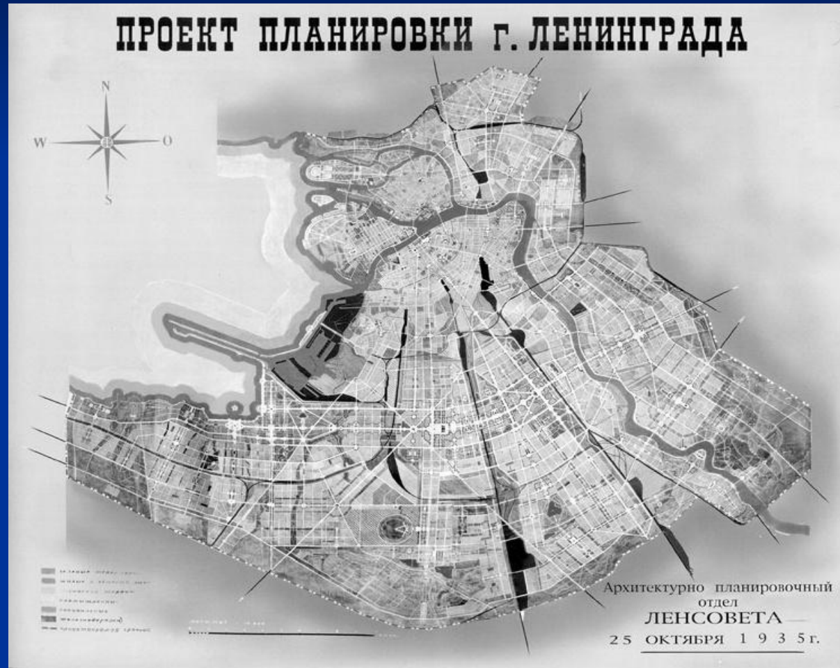
Илл. 11 Проект планировки Ленинграда (1935 г.) Утвержденный вариант