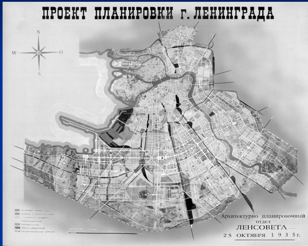
Илл. 11 Проект планировки Ленинграда (1935 г.) Утвержденный вариант

Л.А.Ильин – главный архитектор послереволюционного Петрограда – Ленинграда (1924-1938 гг)»