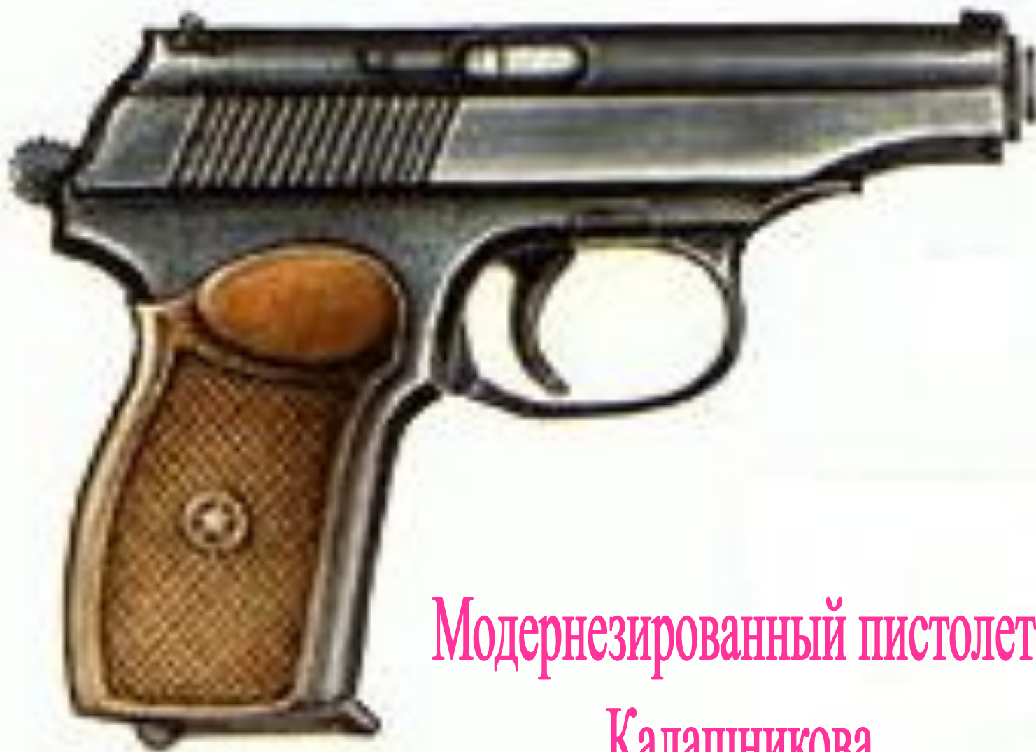
Модернезированный пистолет Калашникова