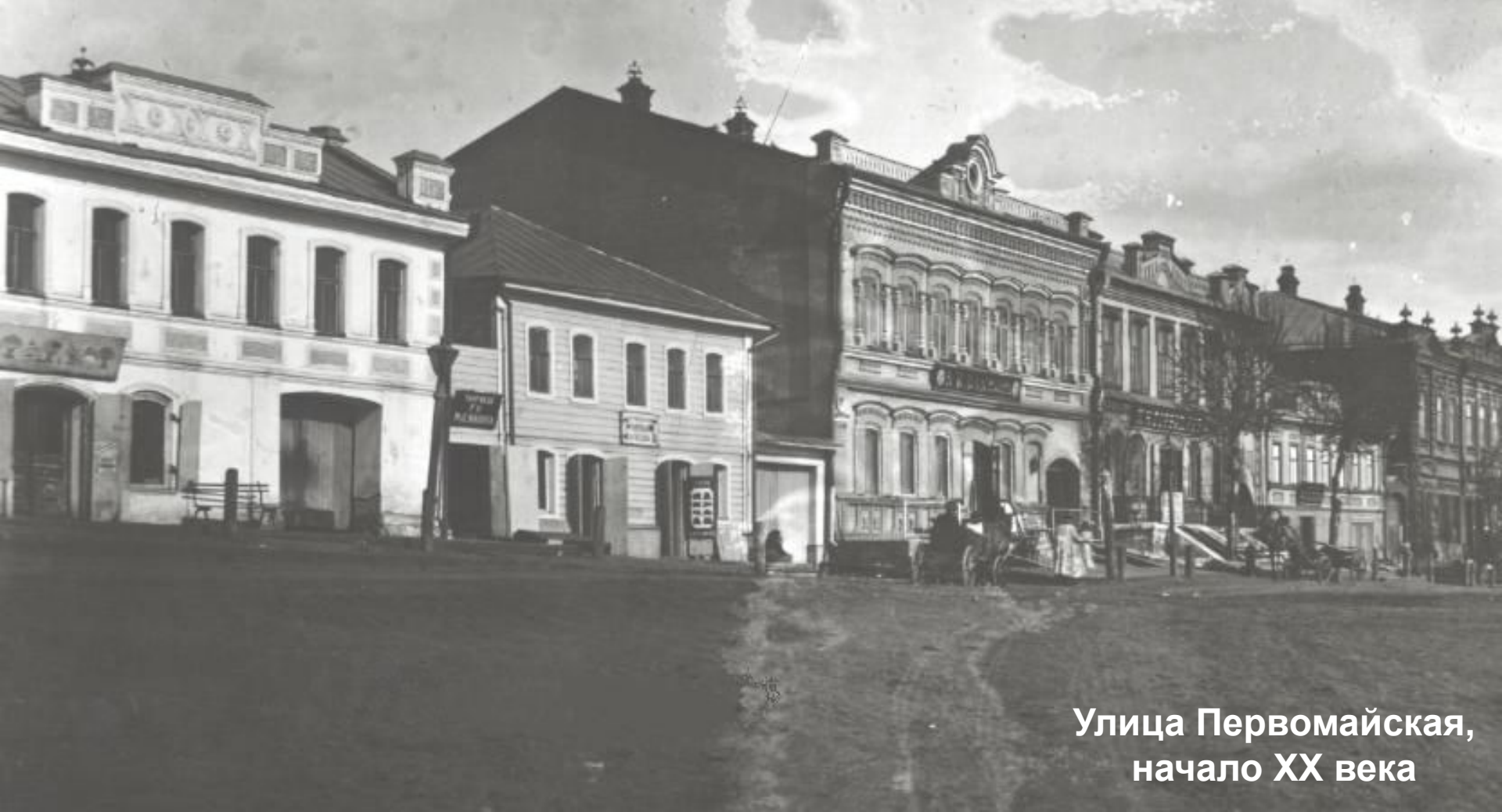
Улица Первомайская, начало XX века

Улица Первомайская в прошлом имела несколько названий: Рыночная, Торговая, Главная, Базарная.