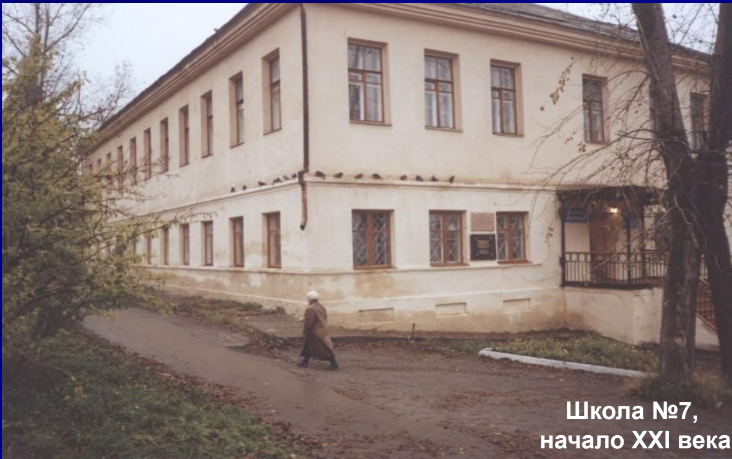
Школа №7, начало XXI века