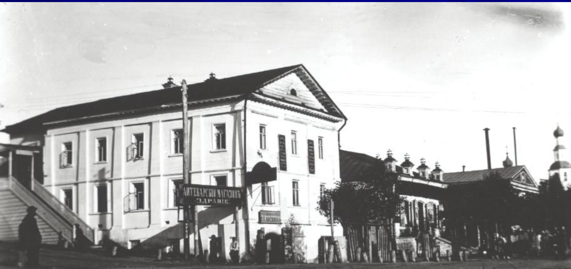
Дом купца Федорова, конец XIX века