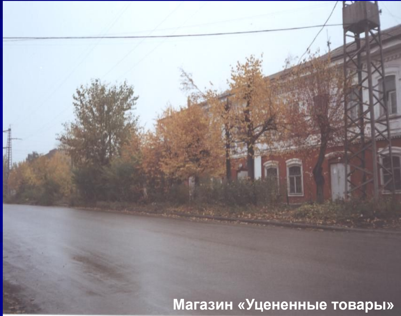
Магазин «Уцененные товары»

В полу магазина была расположена дверца. Открылся глубокий каменный подвал, на самом дне которого просматривались венцы прямоугольного сруба, уходящего вниз и в глубине заваленного землей. Похоже, что это и есть вход в то самое подzemелье, идущее от старой милиции.