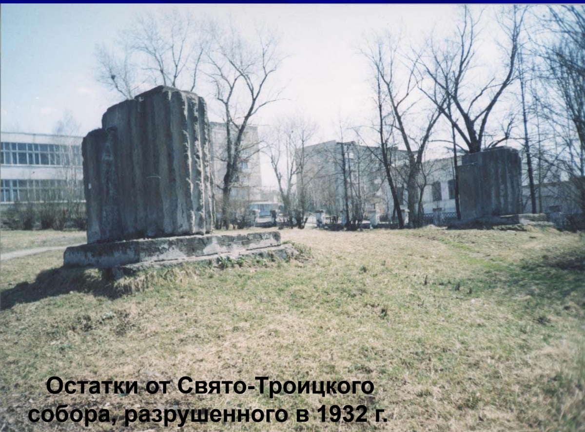
Остатки от Свято-Троицкого собора, разрушенного в 1932 г.