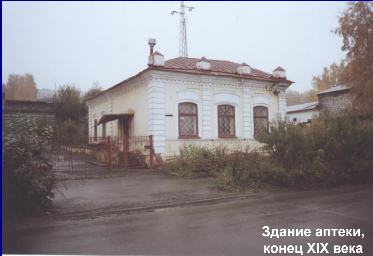
Здание аптеки, конец XIX века

Над оконными проемами, повторяя их дугу, из стены выступают сандрики. Для выделения центрального окна его сандрик сделан длиннее. Здание является памятником архитектуры местного значения.