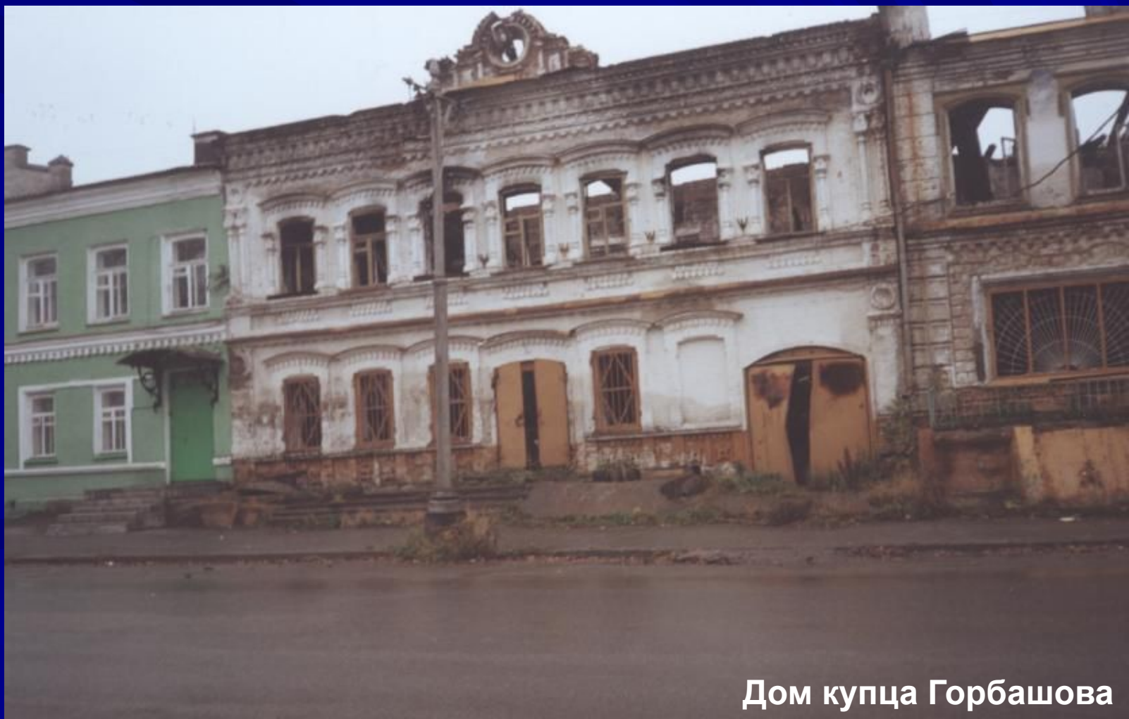
Дом купца Горбашова