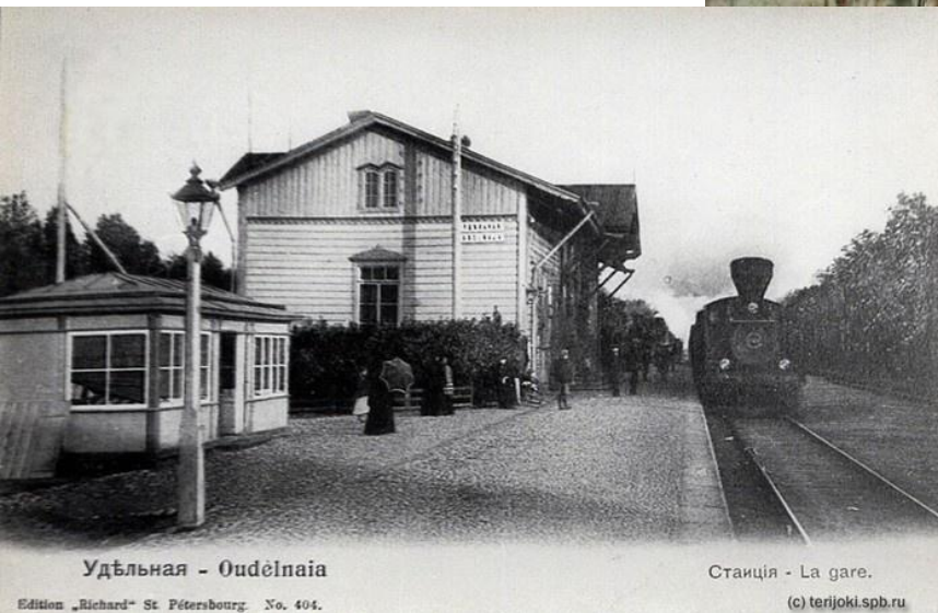
Удельная - Oudelnaja