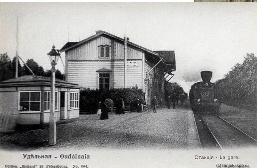
Удельная - Oudelnaja