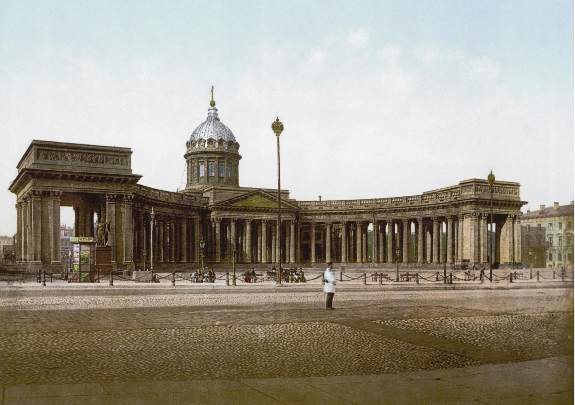
920. P. Z. - ST. PETERSBOURG. LA CATHEDRALE DE KASAN.