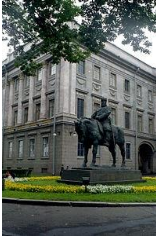
Паоло Трубецкой. Памятник Александру Третьему.