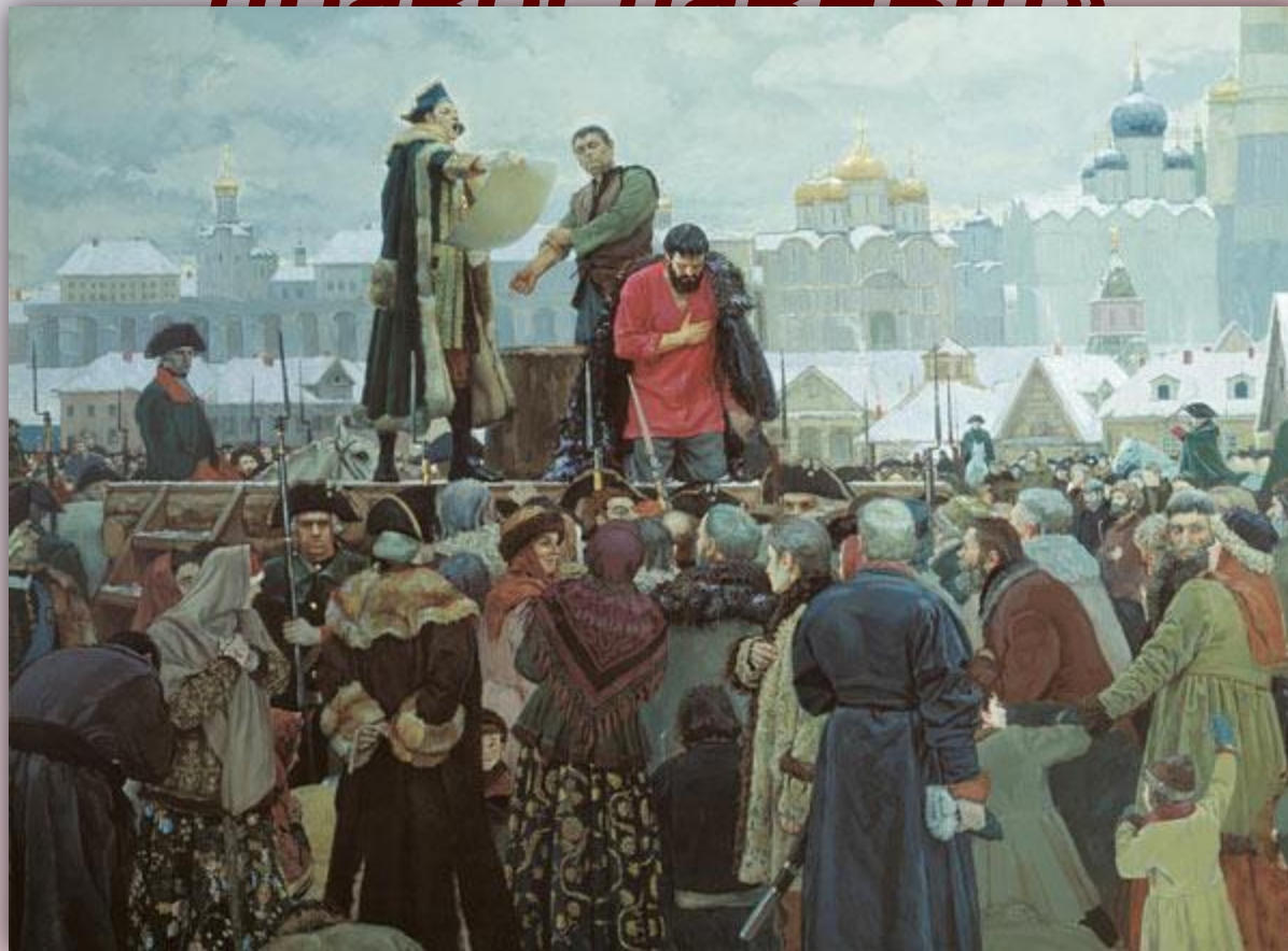
Виктор Маторин. Казнь Пугачева.