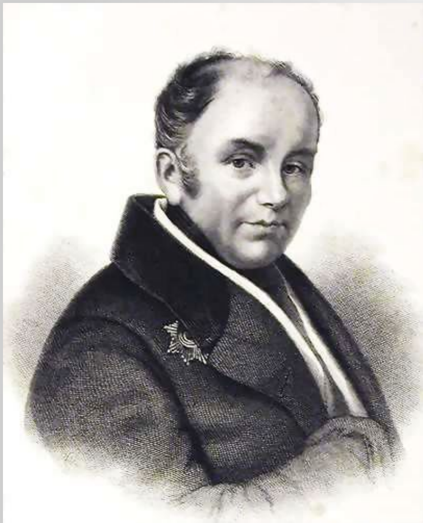
Василий Андреевич Жуковский 1783 – 1852