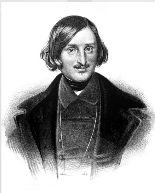
Николай Васильевич Гоголь Белинский