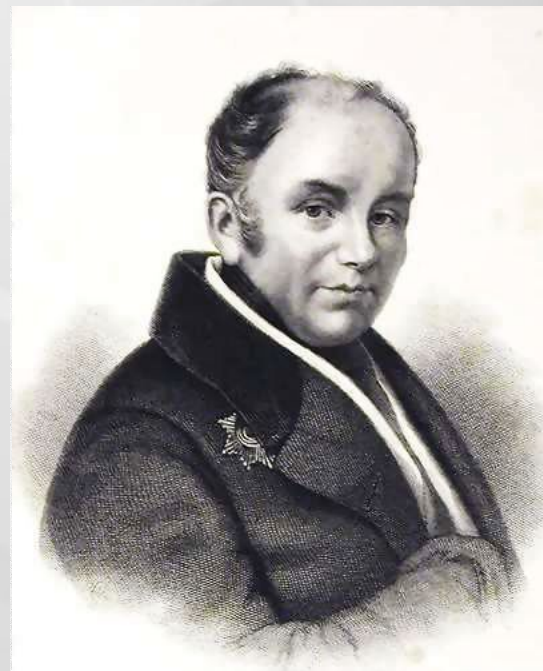
Василий Андреевич Жуковский Герцен