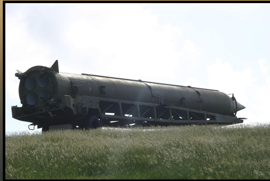
Макет-памятник Р-12 возле Военной Академии в Гаване, Куба

В ходе холодной войны противостояние между двумя сверхдержавами, СССР и США, выразалось не только в прямой военной угрозе и гонке вооружений, но и в стремлении к расширению их зон влияния.