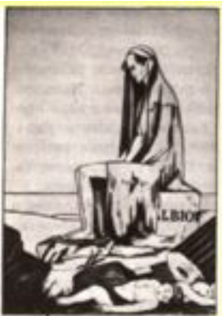
Англия после континентальной блокады. Сатирический рисунок.