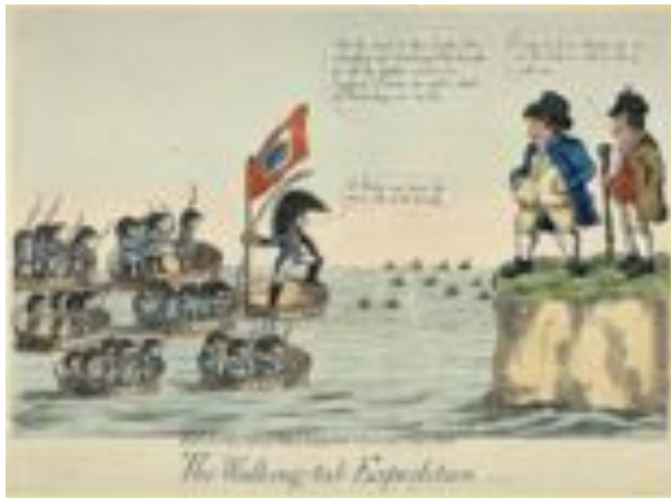
Армия Наполеона плывет в десантных тазиках. Английская карикатура.