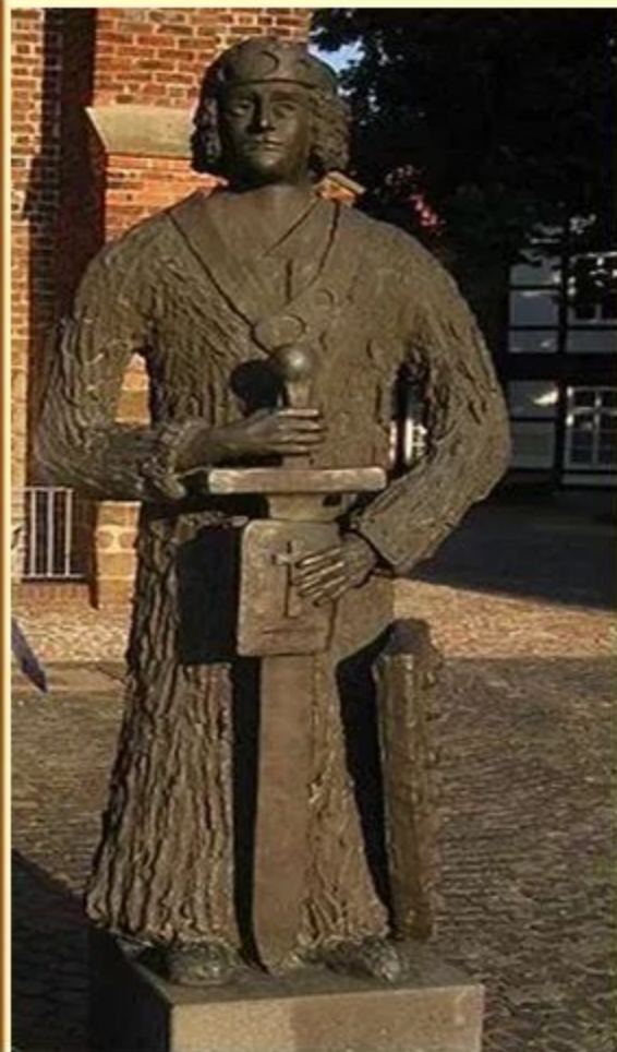
Видукинд – вождь саксов

Карл принуждал саксов принимать христианство. Он ввёл жестокие законы, за малейшее неподчинение королю, за отказ от крещения или отречение от христианской веры, за несоблюдение поста, за похороны по языческому обряду – смерть.