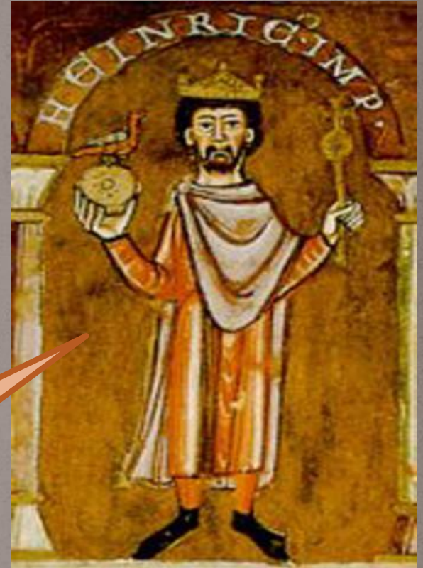
Германский император Генрих IV

Объявил, что лишает Григория VII его сана.