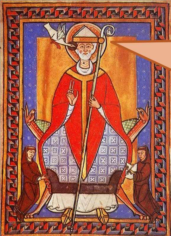
Папа римский Григорий VII

Утверждал, что власть папы выше власти императора. Папа отлучил Генриха IV от церкви.