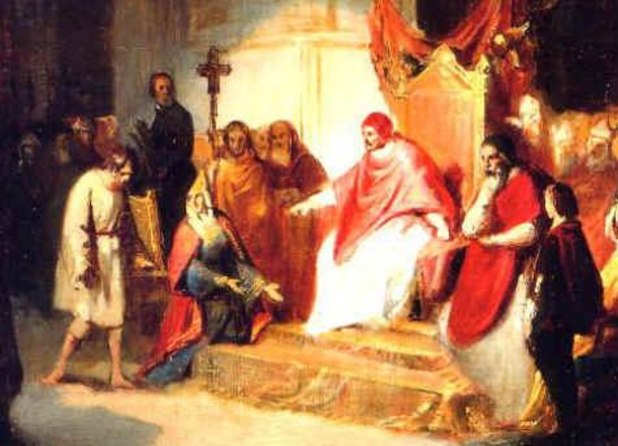
Генрих IV и Григорий VII в Каноссе в 1077