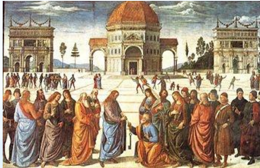
Вручення Ключів Святому Петру

Католики вважають, що саме апостолові Петру Ісус заповідав очолити Церкву.