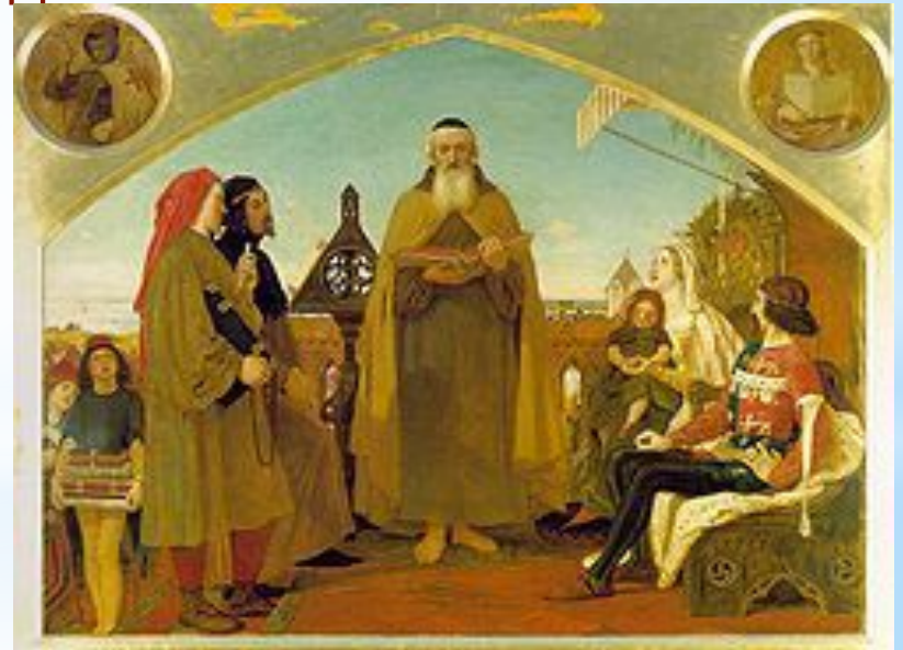
Джон Вікліф читає свій переклад Біблії Джону Гентському

У відповідь на церковні звинувачення Вікліф почав критикувати католицьку практику і вчення. У цей період він спонукав своїх послідовників взятися за переклад Біблії англійською мовою.