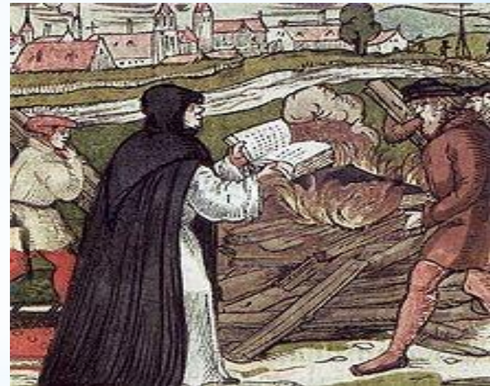
Мартін Лютер спалює буллу