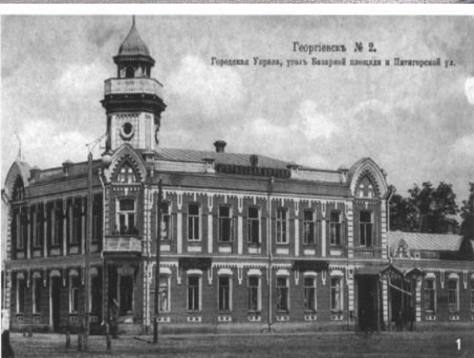
Георгиевск. № 2. Городская Ураля, угол Базарной площади и Пятигорской ул.