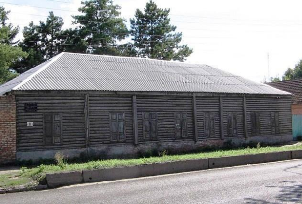
Георгиевск. № 2. Городица Урала, улица Базарной площади и Пятигорской ул.