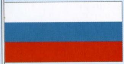
Флаги субъектов Российской Федерации