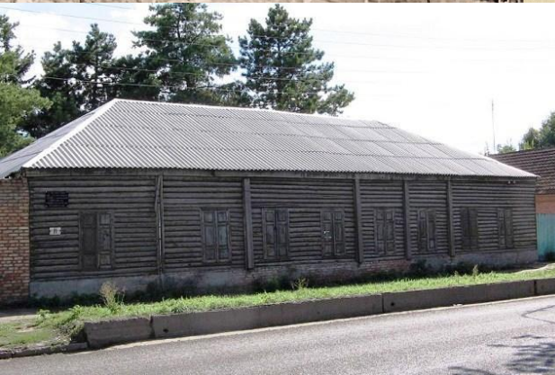
Георгиевск. № 2. Городица Урала, улица Базарной площади и Пятигорской ул.