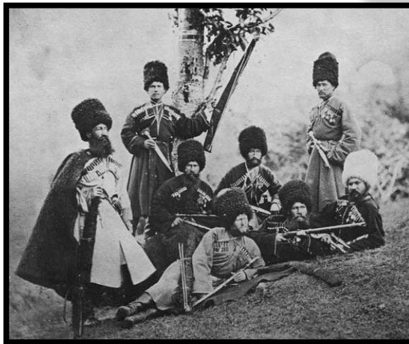
3-й имам Дагестана и Чечни Шамиль, 1797-1871