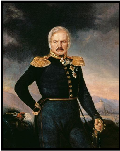
Ермолов, Алексей Петрович 1777-1861 год