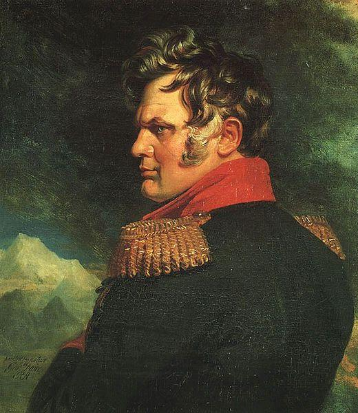
А.П. Ермолов Генерал, главнокома ндующий войсками на Кавказе в 1815-1827 гг.