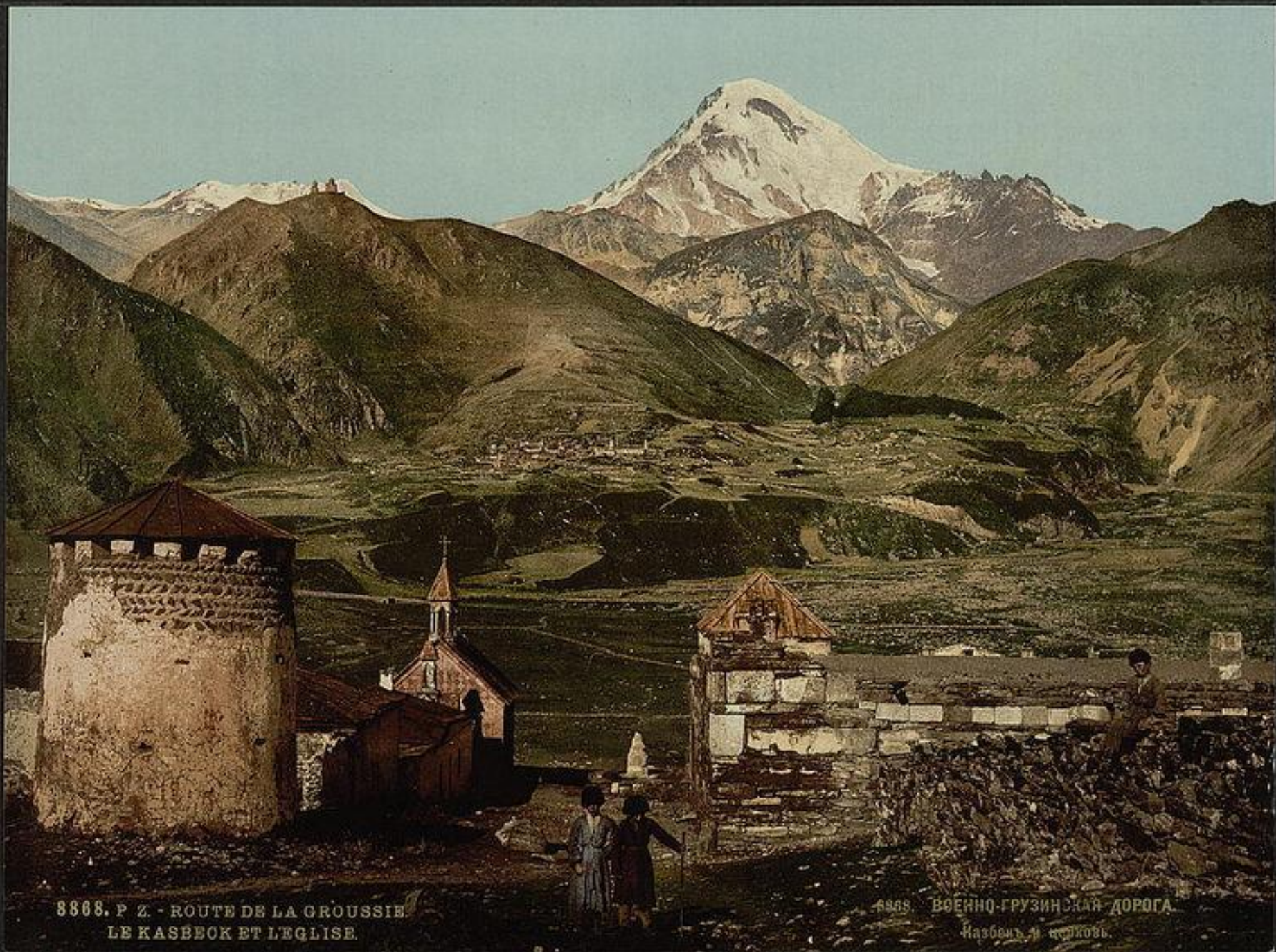
8868. P Z - ROUTE DE LA GROUSSIE. LE KASBEOK ET L'EGLISE.