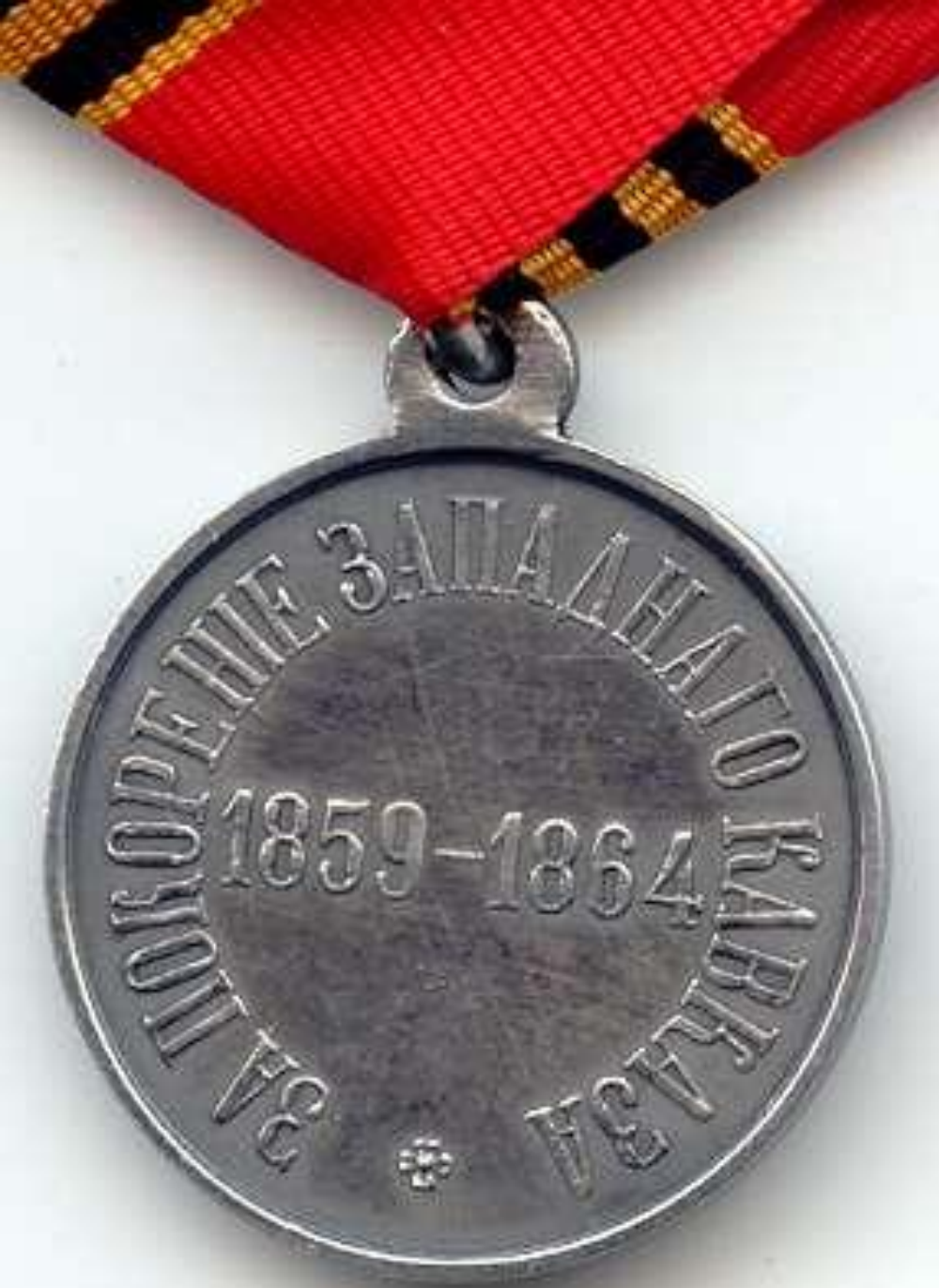
Медаль 'За покорение Западного Кавказа 1859-1864гг.'