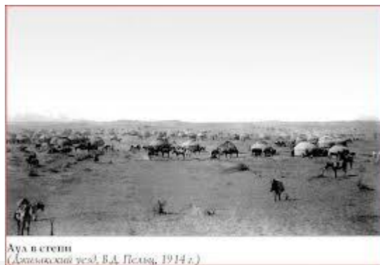
Ауа в степи (Домашний резд, В.А. Пестов, 1914 г.)