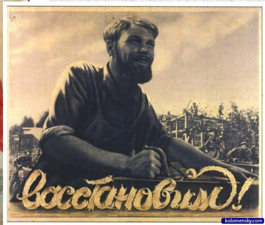
EQ00-8138 Нилтон ЕС Плакат "Мы отстояли Ленинград. Мы вос