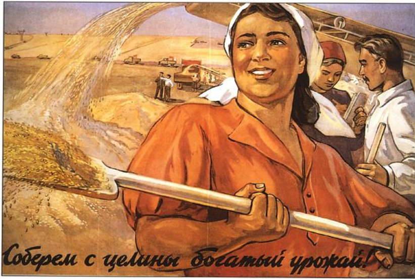
Соберем с целины богатый урожай!