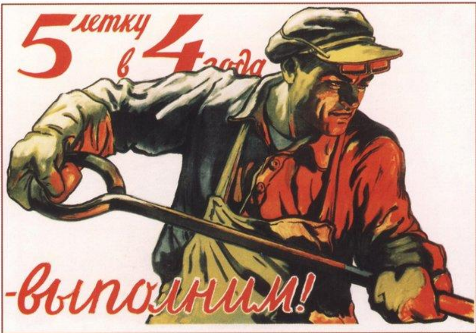
351. Иванов В. 5-летку в 4 года — выполним! 1948