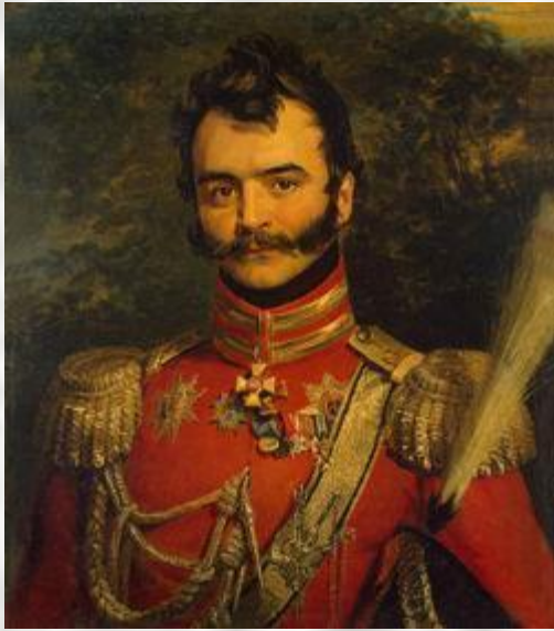
В.В. Орлов- Денисов

9 июня при селе Воскресенском сотня разбила неприятельский авангард (до 1500 солдат), в плен были взяты офицеры и несколько французских солдат.