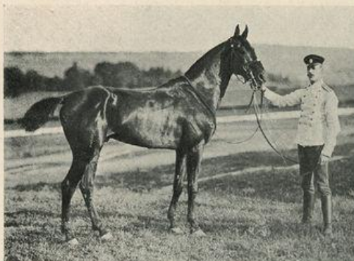
„ФРА - ДІЯВОЛО“.

Кар. жер., зав. Шауфуса, отъ „Лордъ-Фаворита“ и „Фатемы“, род. 1889 г.