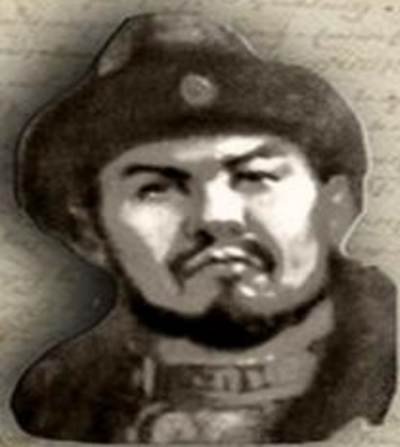
(1445 – 1518) «ҚАСҚА ЖОЛЫ» (СВЕТЛЫЙ ПУТЬ) ҚАСЫМ ХАН