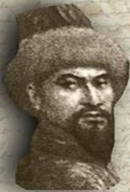
(1626 – 1718) «ЖЕТИ ЖАРҒЫ» (СЕМЬ ЗАКОНОВ) ТӘУКЕ ХАН