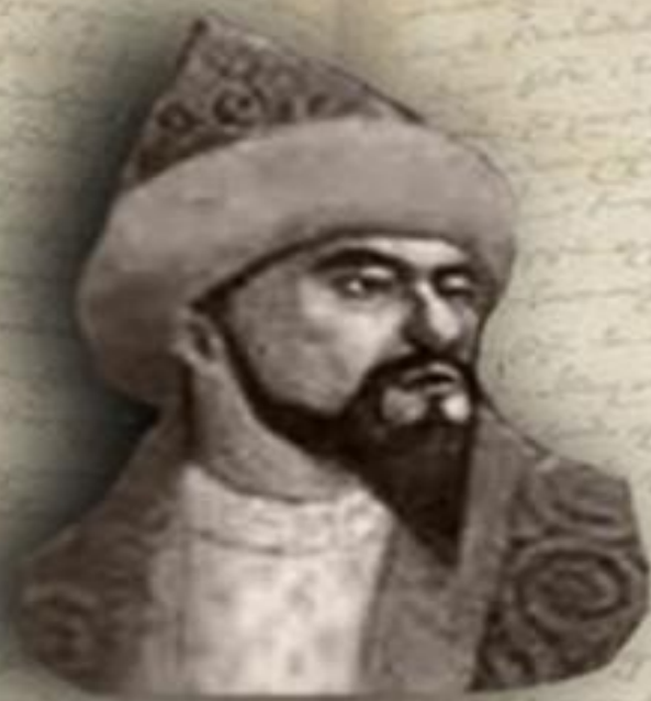
(1598 — 1628) «ЕСКІ ЖОЛЫ» (ДРЕВНИЙ ПУТЬ) ЕСИМ ХАН