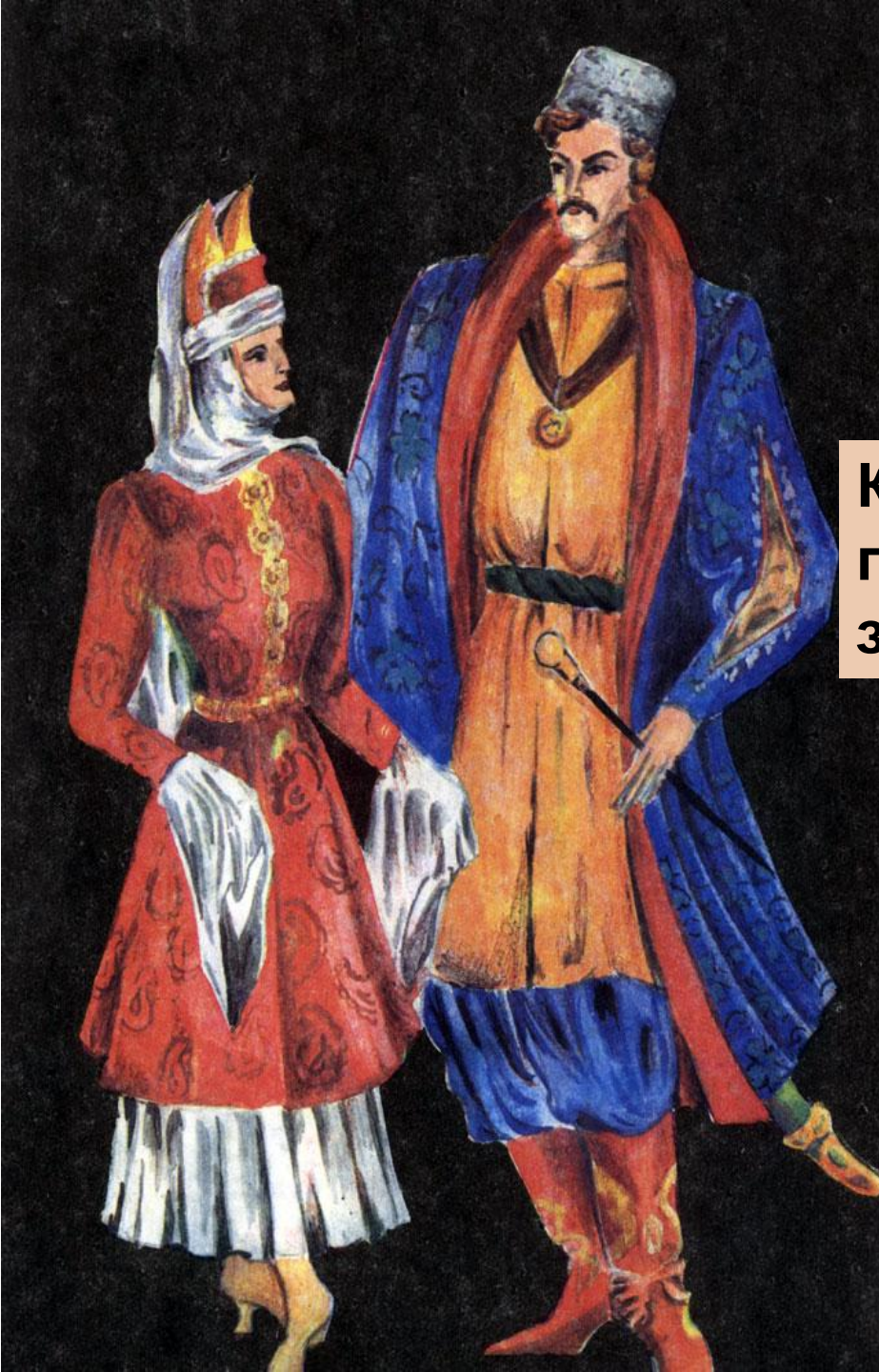
Кафтан поверх зипуна