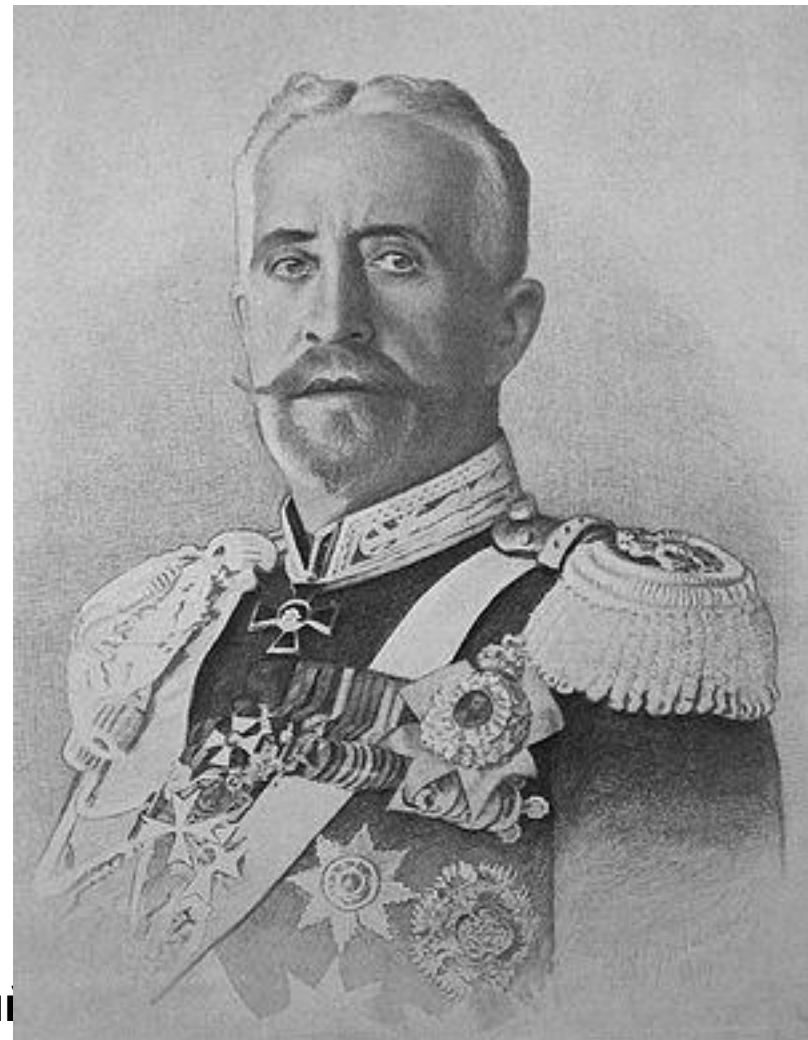
Великий князь Никола́й Никола́евич (Мла́дший)

Командующий не утвердил приговор, «ввиду разногласия судей», но дело решила резолюция верховного главнокомандующего великого князя Николая Николаевича: «Всё равно повесить!»