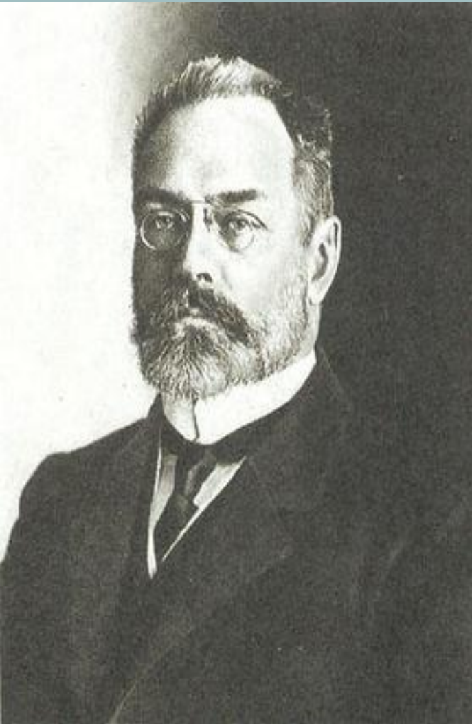
Александр Иванович Гучков

В 1911 восстановлен на службе и перешел в военное министерство. В 1912 против Мясоедова началась крупная интрига, возглавляемая А. И. Гучковым.