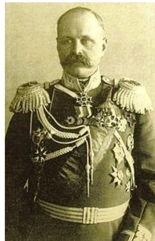
Владимир Фёдорович Джунковский