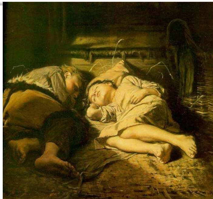
Діти, які сплять