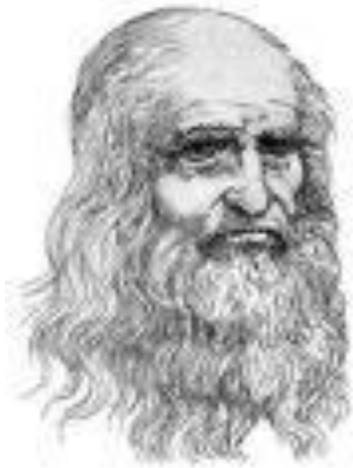
Леонардо да Вінчі