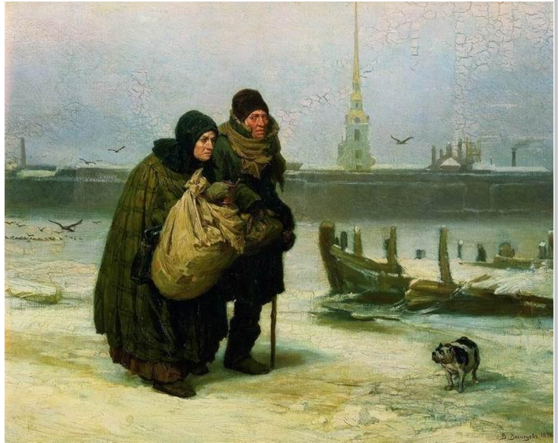
3 квартири на квартиру