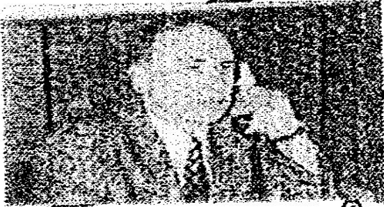
ий ий Просвет